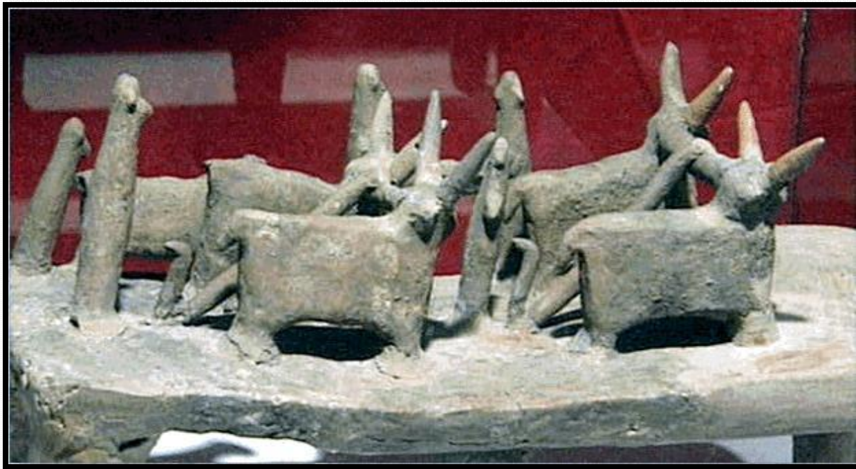
Πήλινο ομοίωμα σκηνής οργώματος από τους Βουνούς