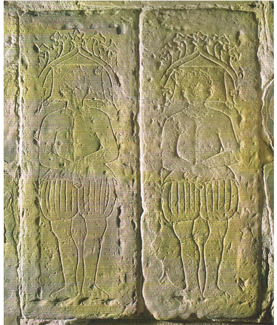
Hauts – de - chausses