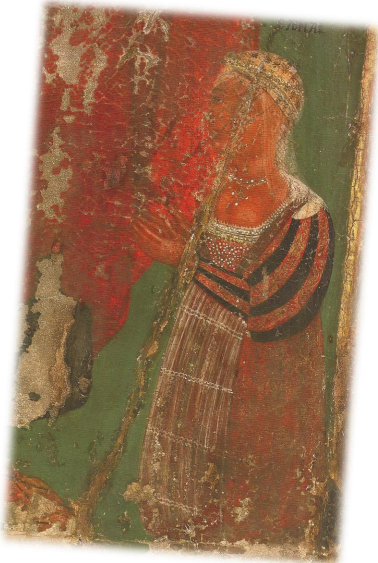
Η κυρά Ελένη