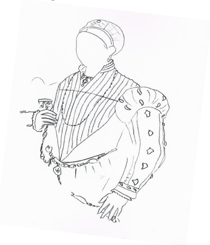
Οι κόρες του δωρητή Ματθαίου Παλαιολόγου