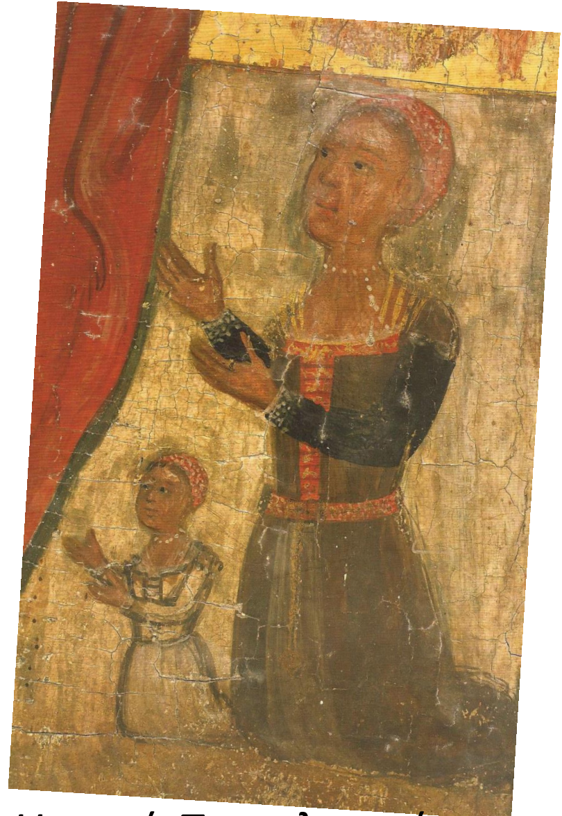
Η κυρά Παπαλεοντίου