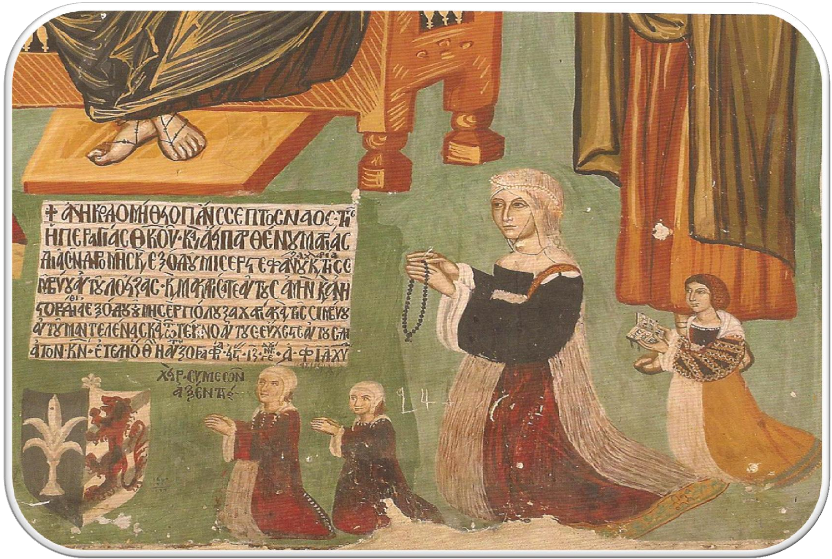
Η Μανταλένα και οι κόρες της