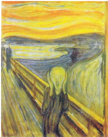
Η Κραυγή, λάδι και παστέλ σε χαρτόνι, 1893

Νορβηγός εξπρεσιονιστής ζωγράφος και χαράκτης. Τα έργα του μπορεί να συνδεθεί και με το συμβολισμό όσο και με τον εξπρεσιονισμό. Ήταν ένα μελαγχολικό άτομο. Τα έργα του μεταδίδουν την ατμόσφαιρα δυστυχίας, αρρώστιας, αγωνίας και νευρικής κατάπτωσης στην οποία έζησε. Το χρώμα παίρνει μορφή, ζωντανεύει, κινείται, παραμορφώνεται.