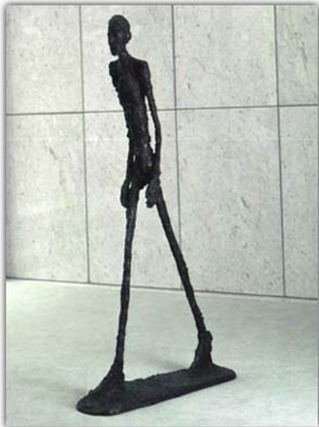
ΤΖΙΑΚΟΜΕΤΙ: ΑΝΘΡΩΠΟΣ ΠΟΥ ΠΕΡΠΑΤΑΕΙ 1960

Η γλυπτική του 20 ου αιώνα δύσκολα μπορεί να αποτελέσει αντικείμενο αυτόνομης μελέτης, όπως εκείνη άλλων εποχών. Η ιστορία της συνδέεται με την ιστορία της ζωγραφικής. Μερικοί καλλιτέχνες, όπως ο Πικάσο και ο Τζιακομέτι είναι και ζωγράφοι και γλύπτες ταυτόχρονα.