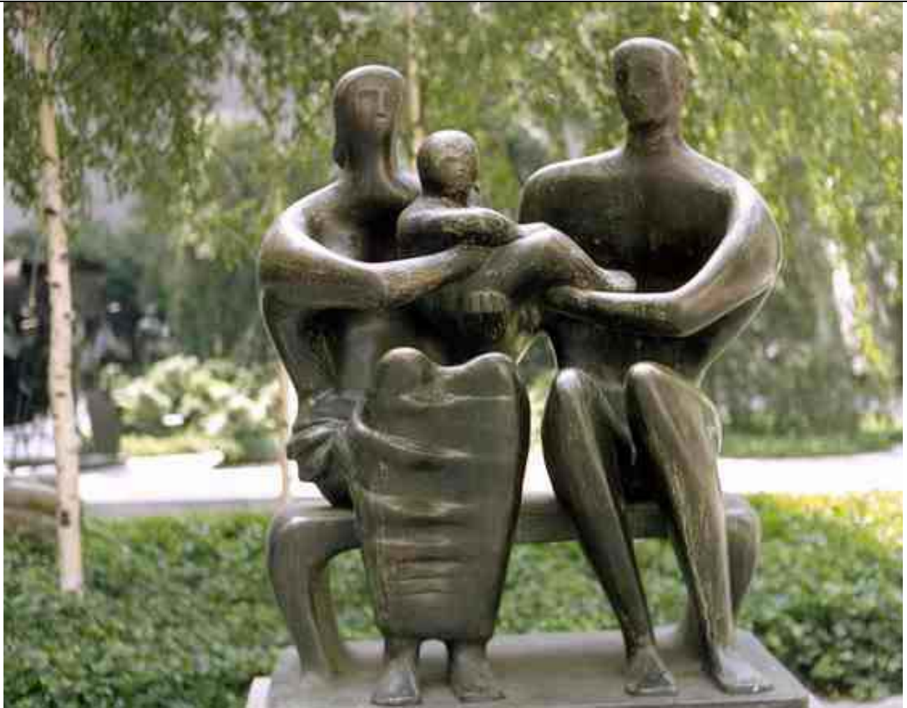
ΜΟΥΡ: ΟΙΚΟΓΕΝΕΙΑ 1949

Ο Χένρυ Μουρ ( Henry Moore , 1898 - 1986) ήταν Άγγλος γλύπτης του εικοστού αιώνα. Ο Μουρ είναι γνωστός για τις μεγάλες αφηρημένες ανθρώπινες φιγούρες του.