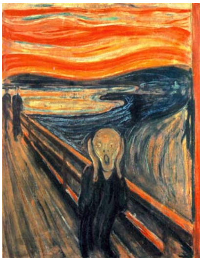
ΜΟΥΝΚ: ΚΡΑΥΓΗ 1893

Χαρακτηριστικά μάλιστα μπορούμε να πούμε πως ελάχιστα εξπρεσιονιστικά έργα έχουν χαρούμενη διάθεση.