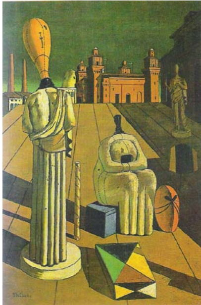
Ντε Κίρικο. "Οι Ανησυχαστικές Μούσες", λάδι, 1916

Ιταλός σουρεαλιστής ζωγράφος, γεννημένος στην Ελλάδα (Βόλος). Είναι ο θεμελιωτής της Μεταφυσικής Ζωγραφικής . Είναι η δημιουργία φανταστικών και μυστηριακών τοπίων. Συνθέσεις από αντικείμενα φαινομενικά άσχετα μεταξύ τους (παράξενες κούκλες χωρίς πρόσωπα, γύψινα αγάλματα και προτομές, φρούτα, κουτιά, γάντια, γεωμετρικά σχήματα κλπ.) τοποθετημένα σε αινιγματικά αρχιτεκτονικά τοπία. Στα έργα του διακρίνουμε ηρεμία , την αντίστροφη προοπτική και Βαριές απειλητικές σκιές .