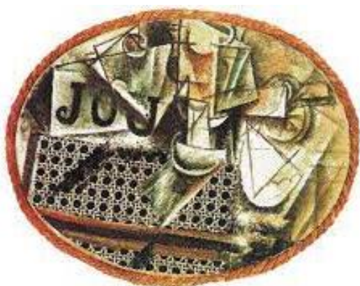
Πάμπλο Πικάσο: «Νεκρή Φύση με ψάθινη καρέκλα», 1912