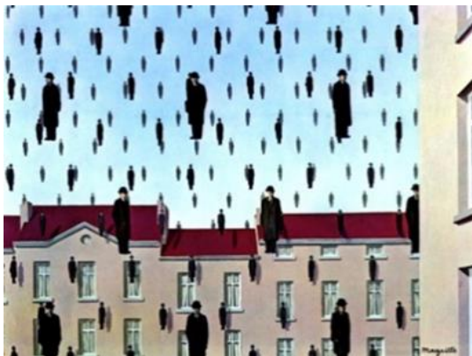
Ρενέ Μαγκρίτ, "Η πτώση", 1953

Να αναφέρετε ένα κύριο χαρακτηριστικό του Σουρεαλισμού , ένα του Φουτουρισμού και ένα του Κυβισμού . (Τα έργα που παρουσιάζονται είναι ενδεικτικά)