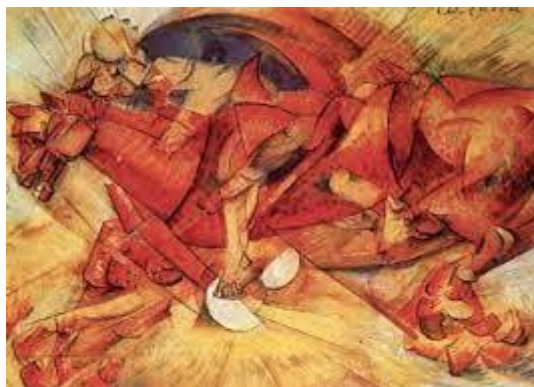
Κάρλο Κάρα: «Ο κόκκινος καβαλάρης», 1913