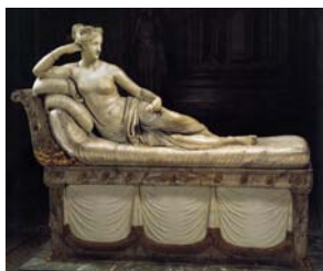
Παολίνα Μπορκίς Κανόβα 1804-1808