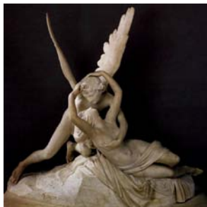
Έρως και Ψυχή Κανόβα 1793