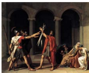
Όρκος των Ορατίων Νταβίντ 1785