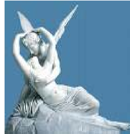
Κανόβα: Έρως και Ψυχή 1793.