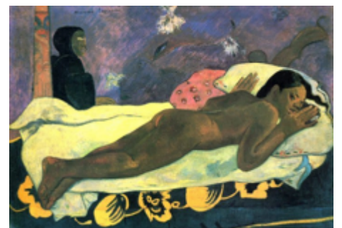
Πωλ Γκωγκέν «Το πνεύμα του νεκρού κοιτάζει» 1892