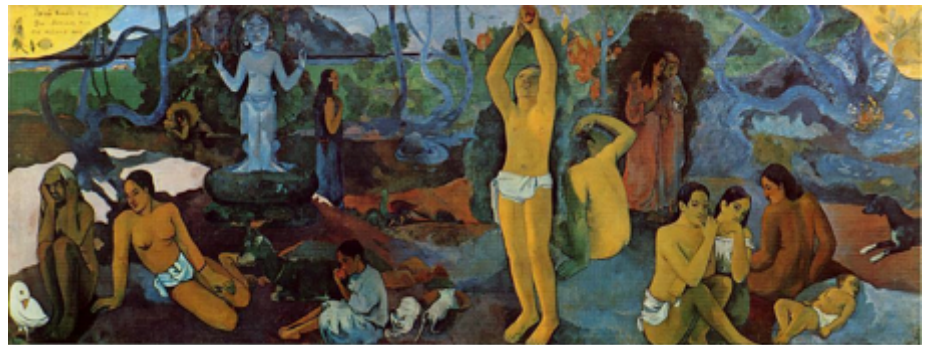
Πωλ Γκωγκέν «Από που ερχόμαστε, ποιοι είμαστε, που πάμε» 1898