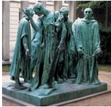
Ογκύστ Ροντέν «Οι αστοί του Καλέ» 1886