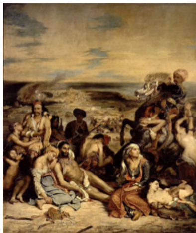
Ευγένιος Ντελακρουά «Η καταστροφή της Χίου» 1824