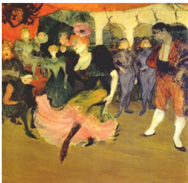
Τουλούζ Λωτρέκ: «Χορός στο Μουλέν Ρουζ», 1890