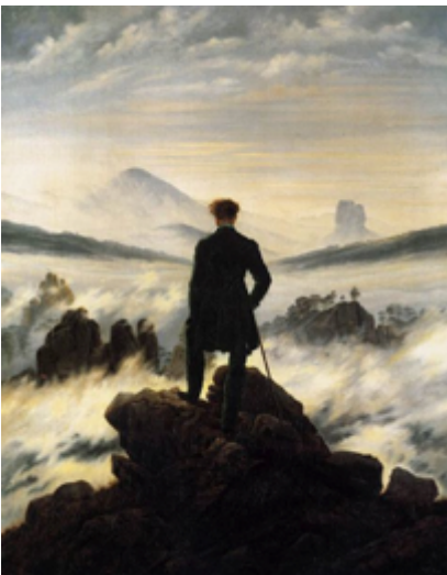
Κ.Ντ. Φρίντριχ «Ο μοναχικός περιπατητής στα σύννεφα» 1817-1818