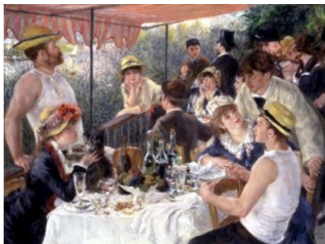
Πιερ Ογκύστ Ρενουάρ «Το γεύμα μετά από τη βαρκάδα» 1881