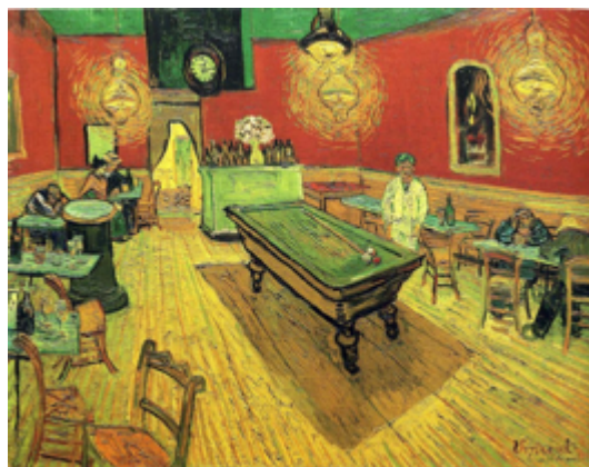
Βίνσεντ Βαν Γκογκ: «Το νυχτερινό καφενείο», 1890