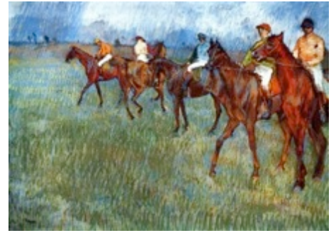
Εντγκάρ Ντεγκά «Οι αναβάτες μέσα στη βροχή» 1881