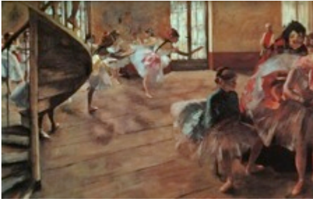
Εντγκάρ Ντεγκά «Πρόβα Μπαλέτου» 1874