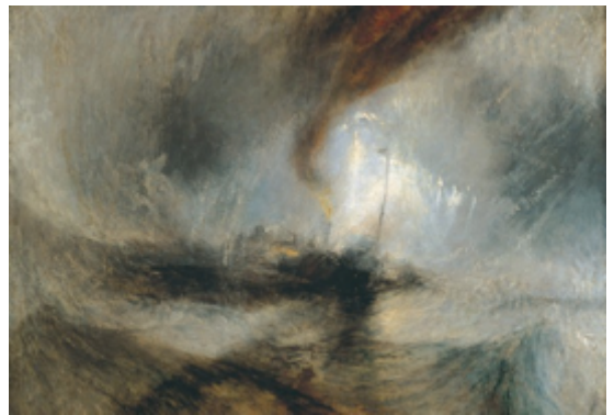
Τέρνερ «Ατμόπλοιο σε χιονοθύελλα» 1842