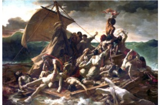
Τεοντόρ Ζερικό «Η σχεδία της Μέδουσας» 1818