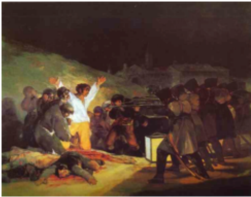
Φραντζίσκο Γκόγια «Οι τουφεκισμοί της 3ης Μαΐου» 1814