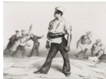
Ονόρε Ντωμιέ «Η ελευθερία του τύπου» 1834