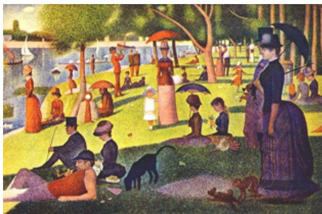
Ζωρζ Σερά: «Κυριακάτικο απόγευμα στο νησί του Γκραντ Ζατ», 1884-1886