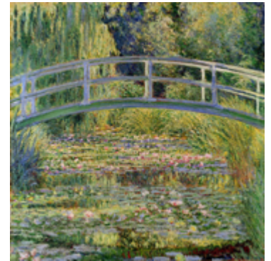
Κλωντ Μονέ «Η λίμνη με τα νούφαρα» 1897-1899