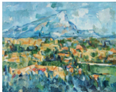
Πωλ Σεζάν «Το βουνό του Σεν Βικτουάρ» 1904-1906