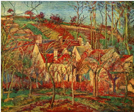
Καμίλ Πισαρό «Οι κόκκινες στέγες» 1877