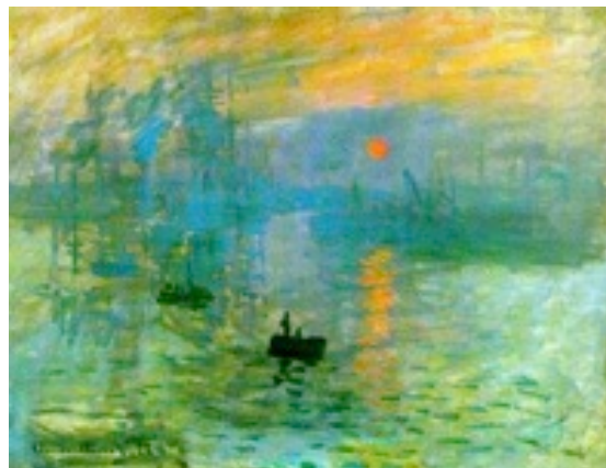
Κλωντ Μονέ «Εντύπωση, ανατολή του ηλίου» 1872