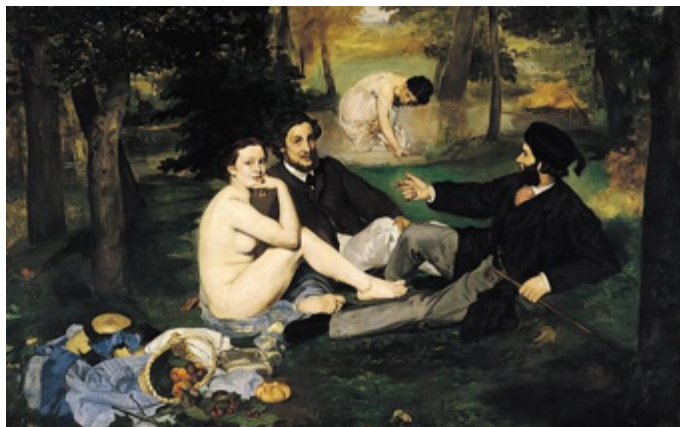
Εντουάρ Μανέ «Πρόγευμα στη χλόη» 1863