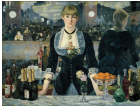
Εντουάρ Μανέ «Το Μπαρ του Φολί Μπερζέρ» 1882