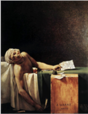
Ζακ-Λουί Νταβίντ «Ο θάνατος του Μαρά», 1793