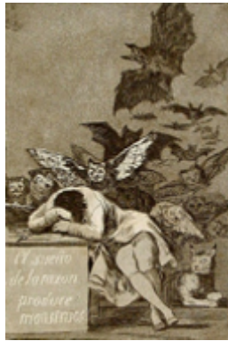
Φραντζίσκο Γκόγια «Ο ύπνος της λογικής γεννάει τέρατα» 1797-1799