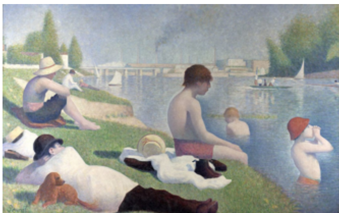
Ζωρζ Σερά: «Λουόμενοι στην Ανιέρ», 1884