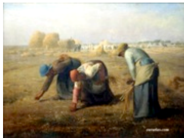
Φρανσουά Μιλέ «Οι σταχομαζώχτρες» 1857