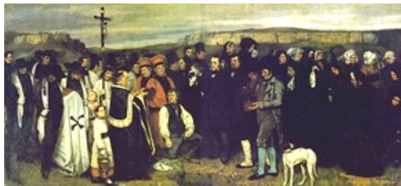
Γκούσταβ Κουρμπέ «Η ταφή στο Αρνάν» 1854-1850