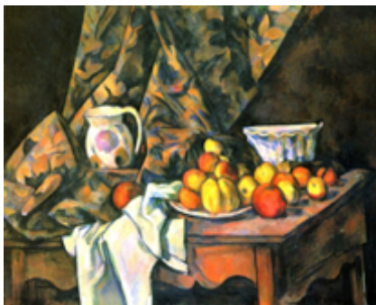
Πωλ Σεζάν «Νεκρή Φύση με ροδάκινα και μήλα» 1905