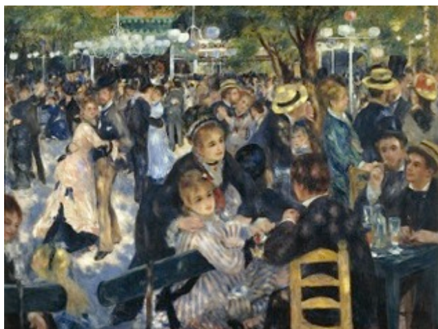
Πιερ Ογκύστ Ρενουάρ «Το Μουλέν ντε Γκαλέτ» 1876