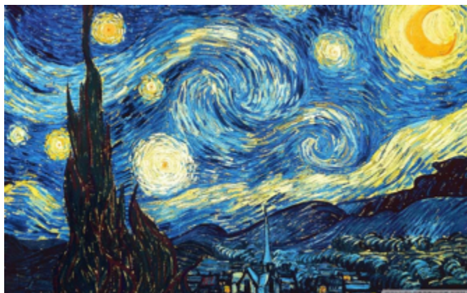
Βίνσεντ Βαν Γκογκ: «Εναστρη νύχτα», 1889