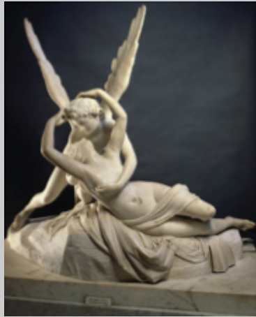
Αντόνιο Κάνοβα «Έρωτας και ψυχή» 1787-1793