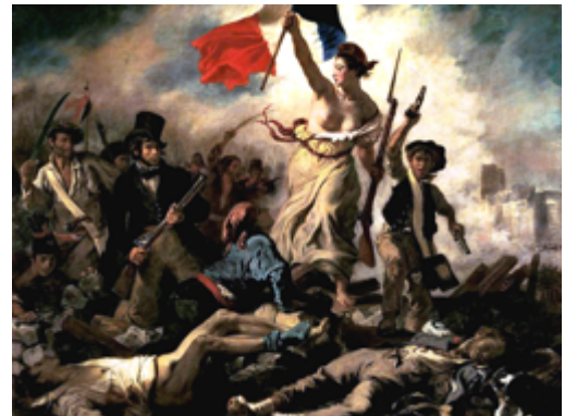
Ευγένιος Ντελακρουά «Η Ελευθερία οδηγεί τον λαό» 1830