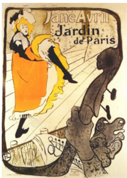
Τουλούζ Λωτρέκ: «Η Ζαν Αβριλ στο Ζαρντέν ντε Παρί» 1893