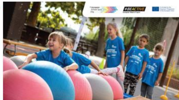
European School Sport Day

Το Υπουργείο Παιδείας, Πολιτισμού, Αθλητισμού και Νεολαίας ως εθνικός συντονιστικός φορέας για επιστροφή στην άσκηση και στον Αθλητισμό