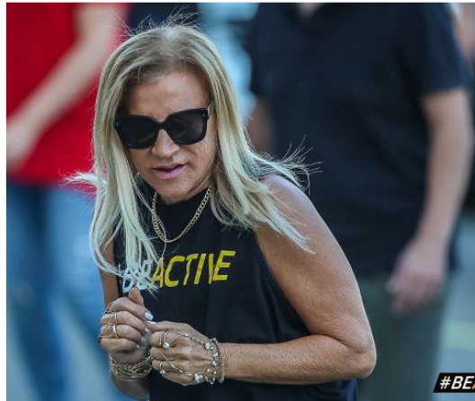
Cyprus Sports Authority Board Member