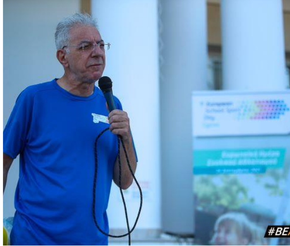
Minister of Education