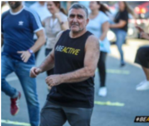
Head of PE Sec.Educ.