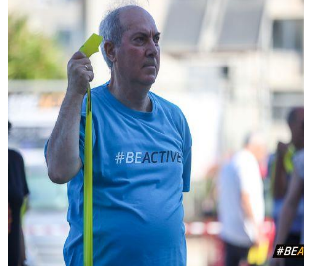
Director Second. Education