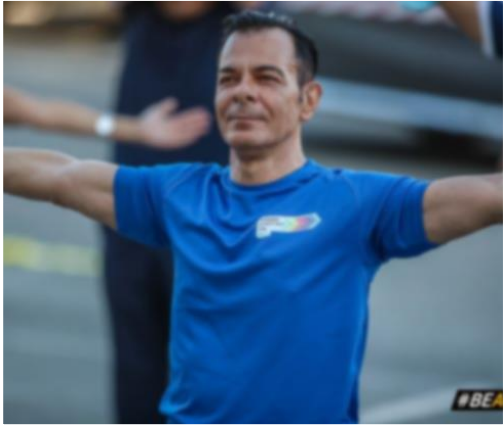
Head of Culture & Sports Dpt