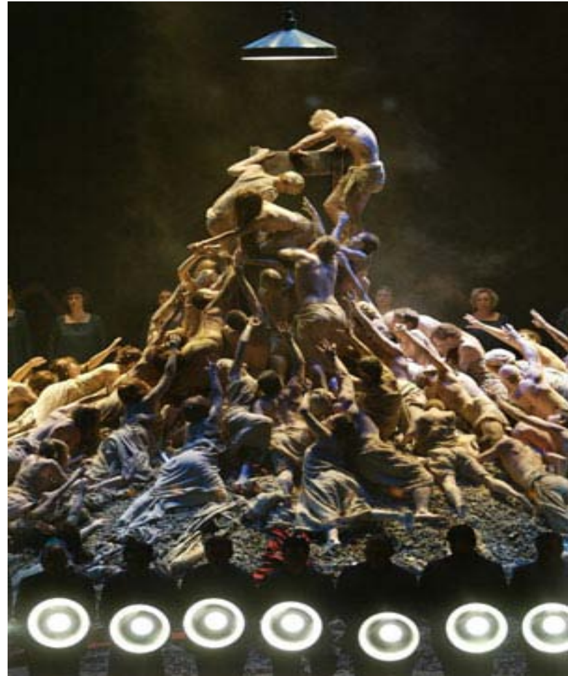
Οιδίποδας Τύραννος, Όπερα του Καναδά, 2002