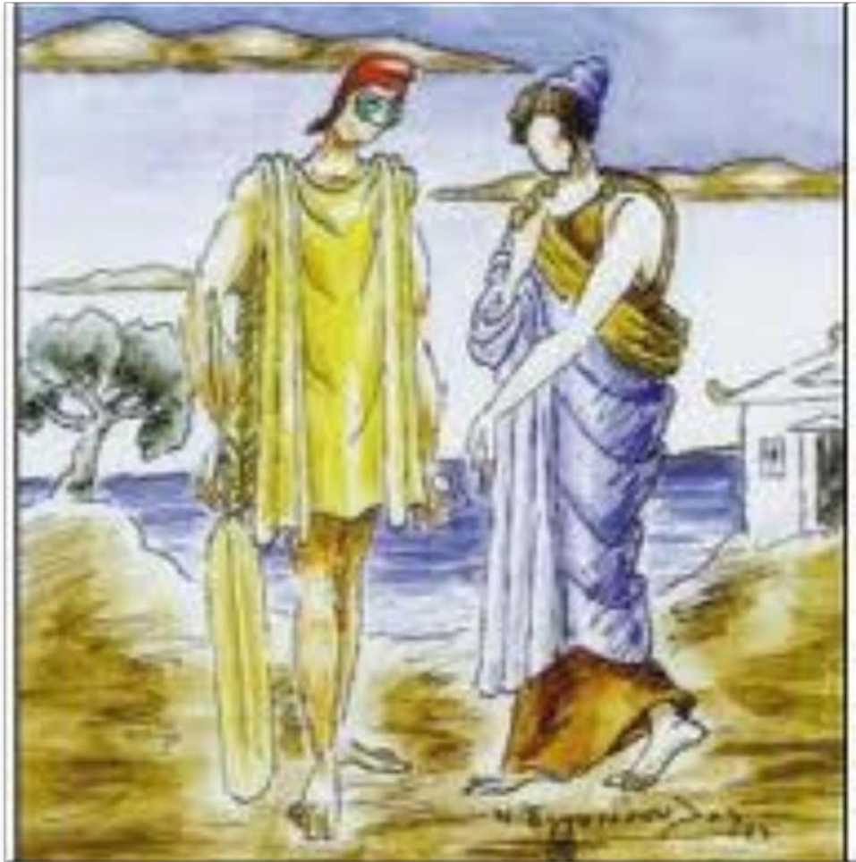
Ν. Εγγονόπουλος «Πηνελόπη και Οδυσσέας»

ΤΟ ψ της Οδύσσειας : φιλολογική προσέγγιση