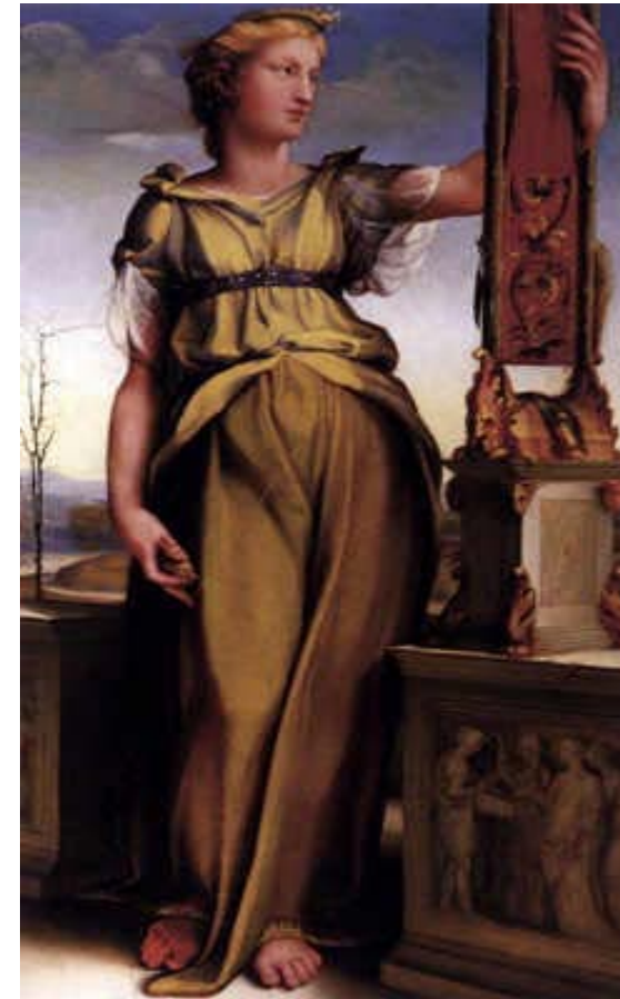
Domenico Beccafumi, 1519