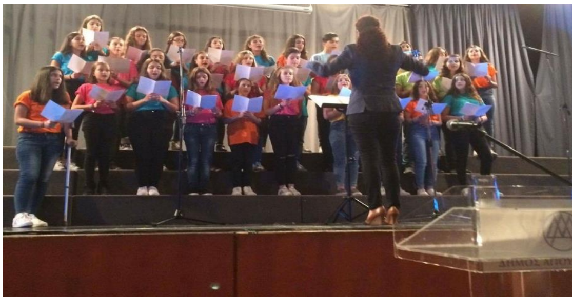
Φιλανθρωπικό τσάι του Συνδέσμου γονέων στις 13/5/2017!