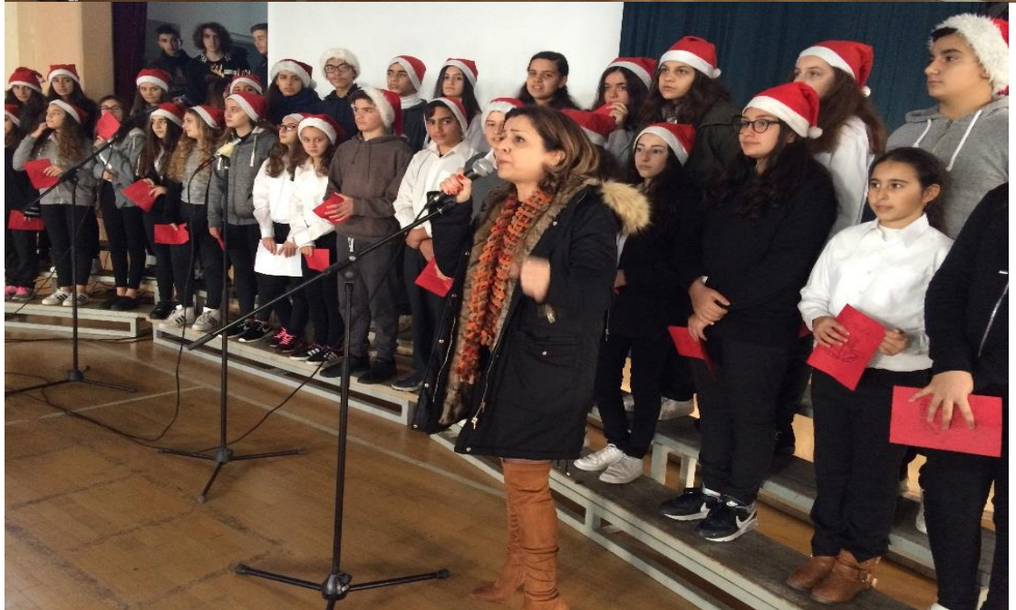
Χριστουγεννιάτικη εκδήλωση 23/12/2016