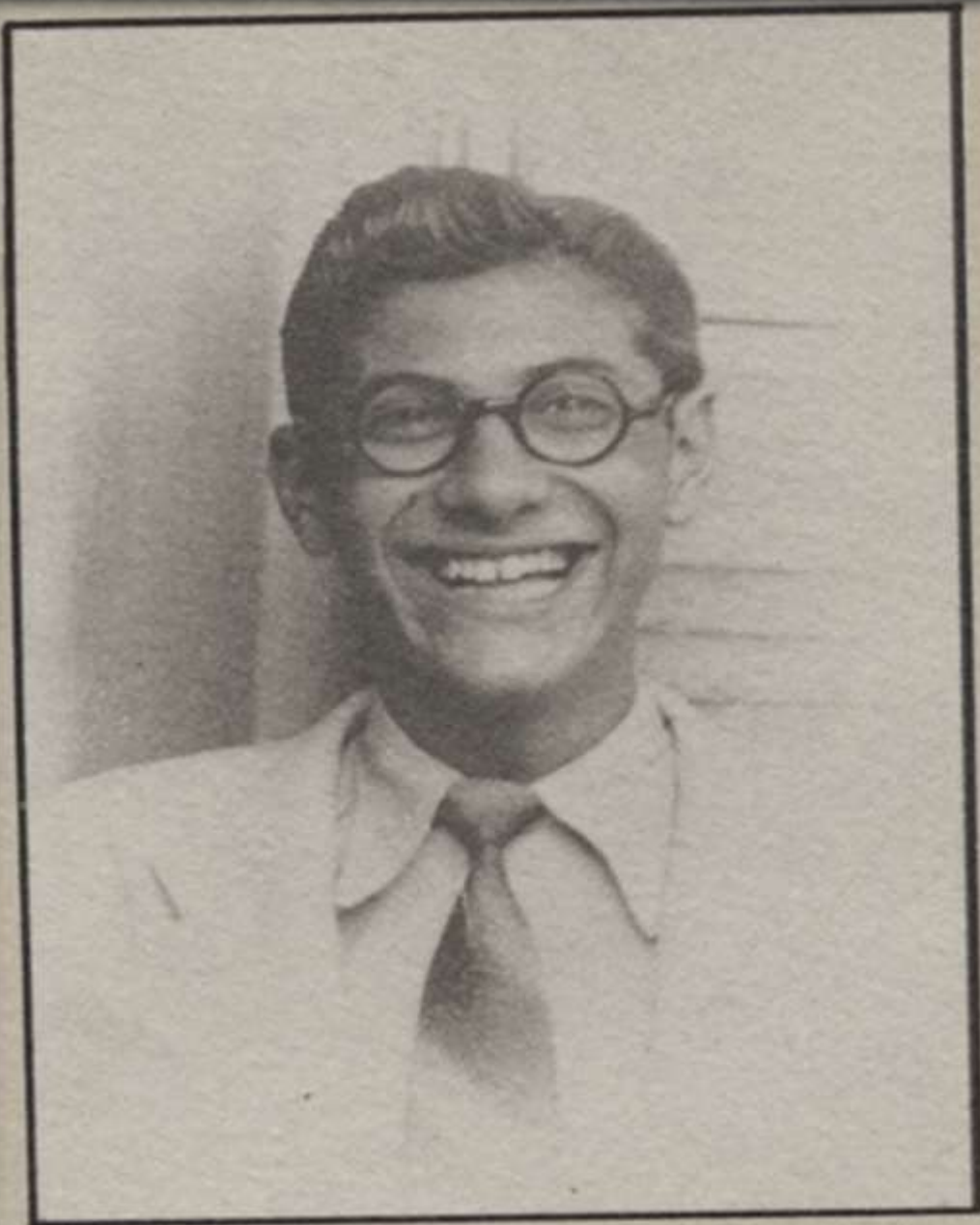
Νεανική φωτογραφία του ποιητή