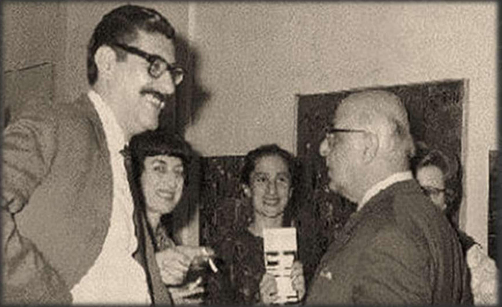
Ο Γιώργος Σεφέρης με τον Μανόλη Αναγνωστάκη, τη Νόρα Αναγνωστάκη και τη Ντόρα Τσάτσου στην Αίθουσα «Τέχνη» της Θεσσαλονίκης, 1964