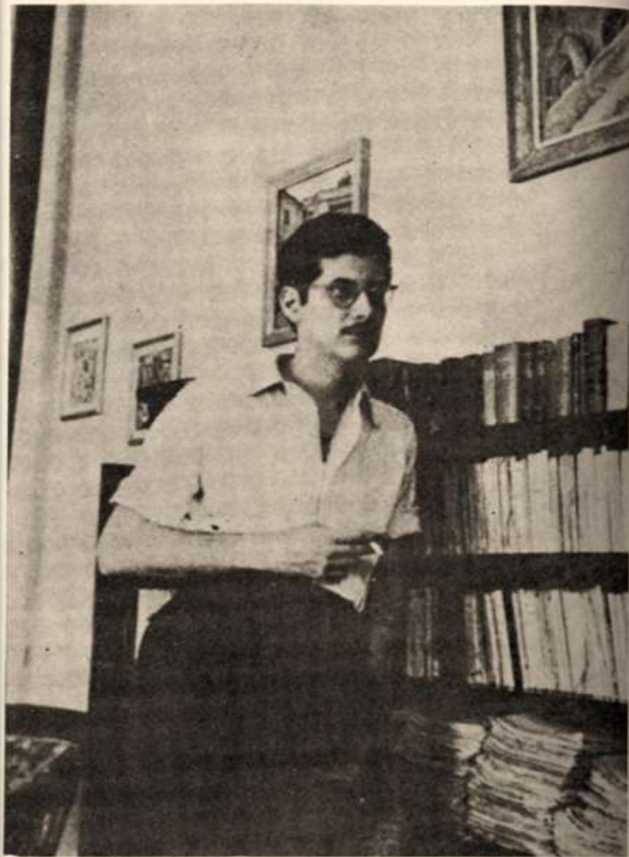
Ο Μανόλης Αναγνωστάκης τὸ 1952