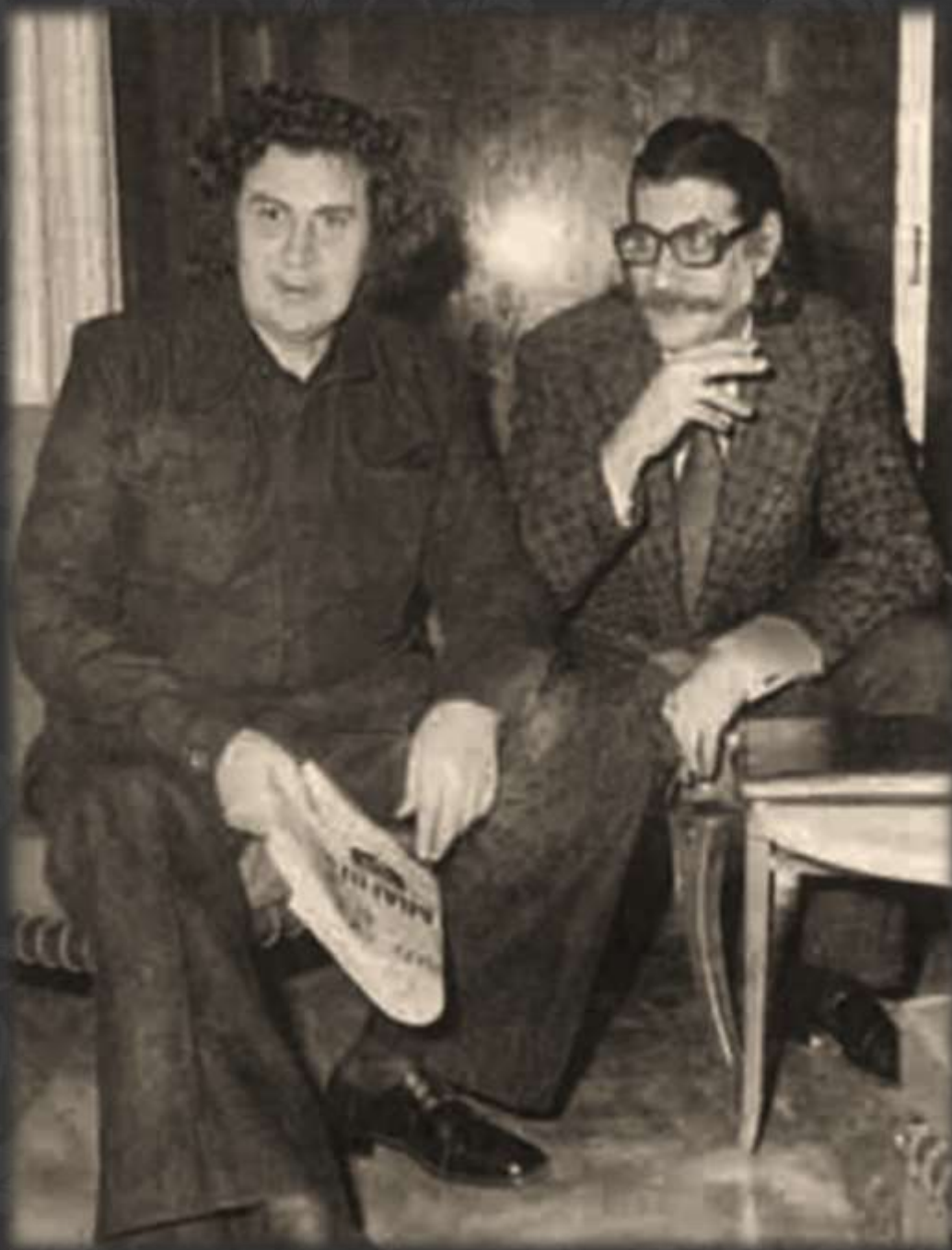
Μίκης Θεοδωράκης και Μανόλης Αναγνωστάκης, Θεσσαλονίκη 1975