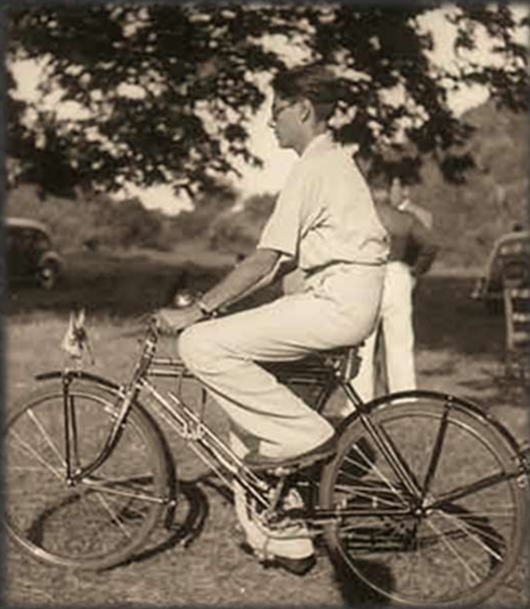
Θεσσαλονίκη, λίγο πριν από τον πόλεμο