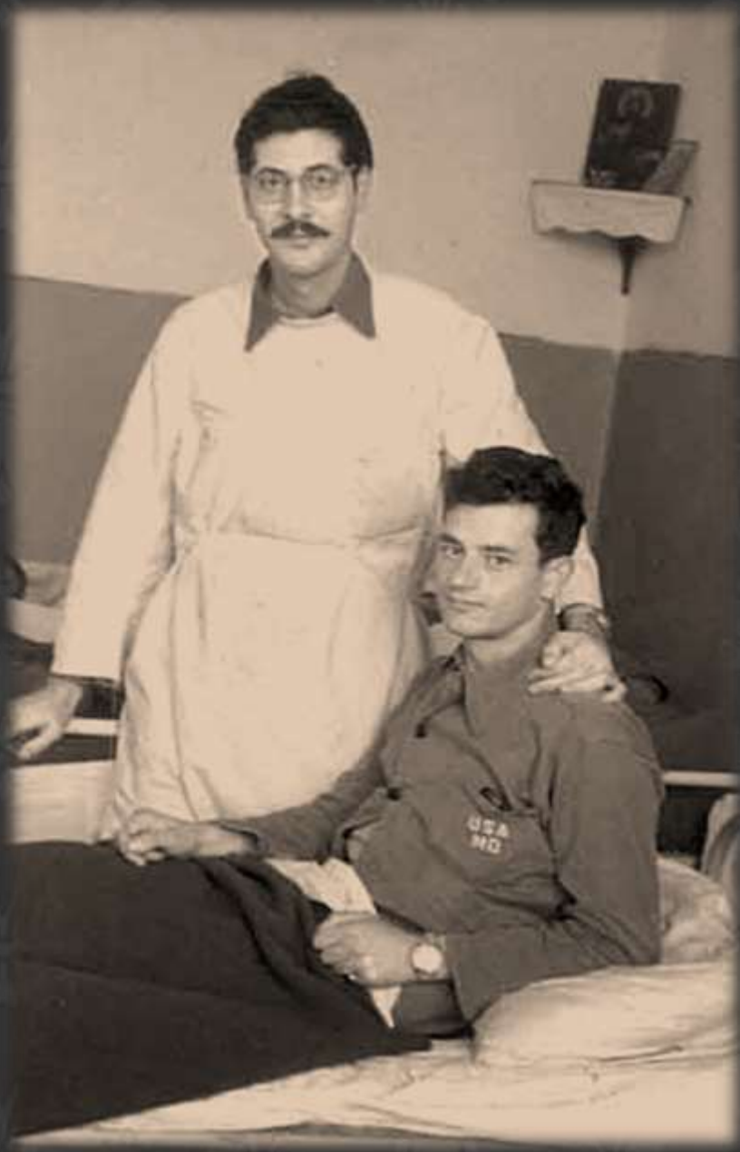
Ιωάννινα, 10 Νοεμβρίου 1954