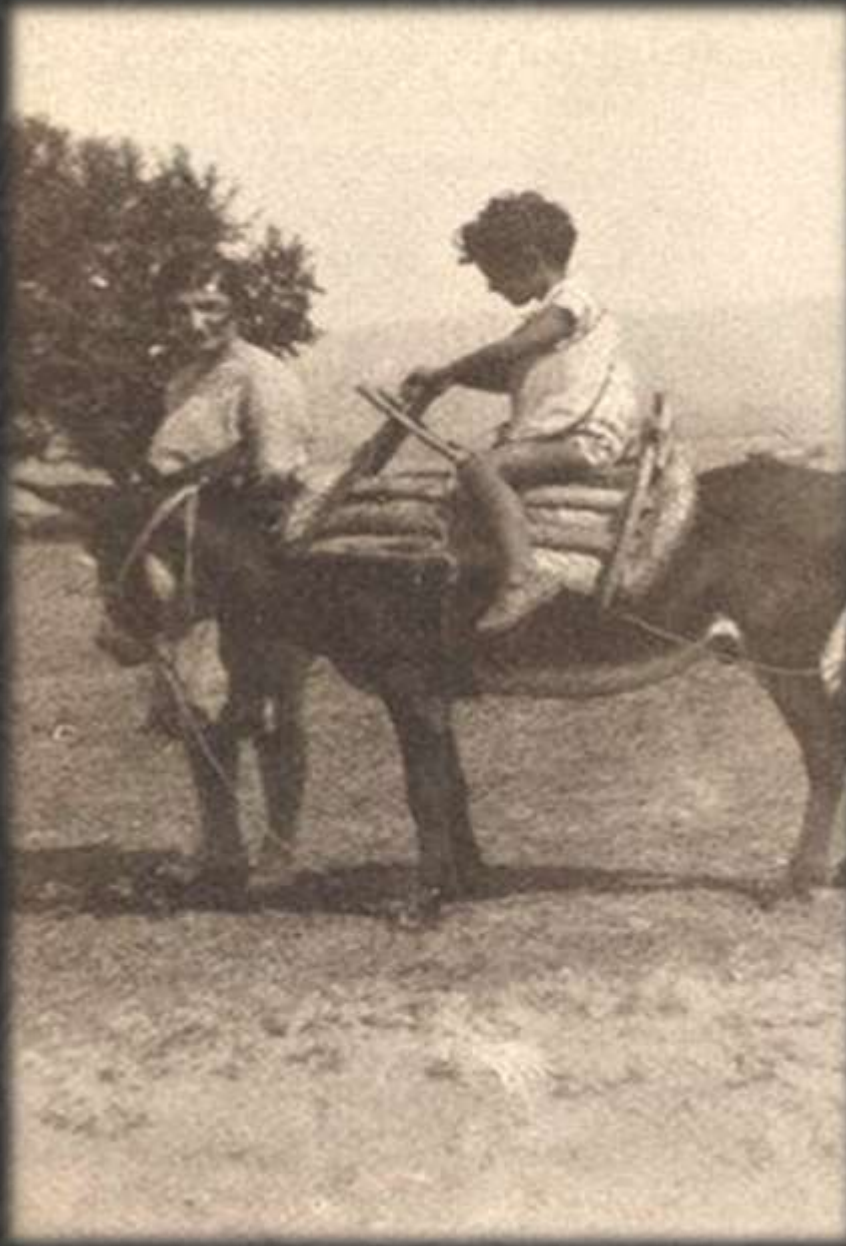
Ο ποιητής σε ηλικία τριών χρόνων, 1928