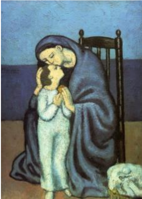
Pablo Picasso, «Μητρότητα», 1901.