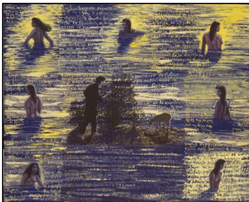
Ζωγράφος: Δημήτρης Μοράρος