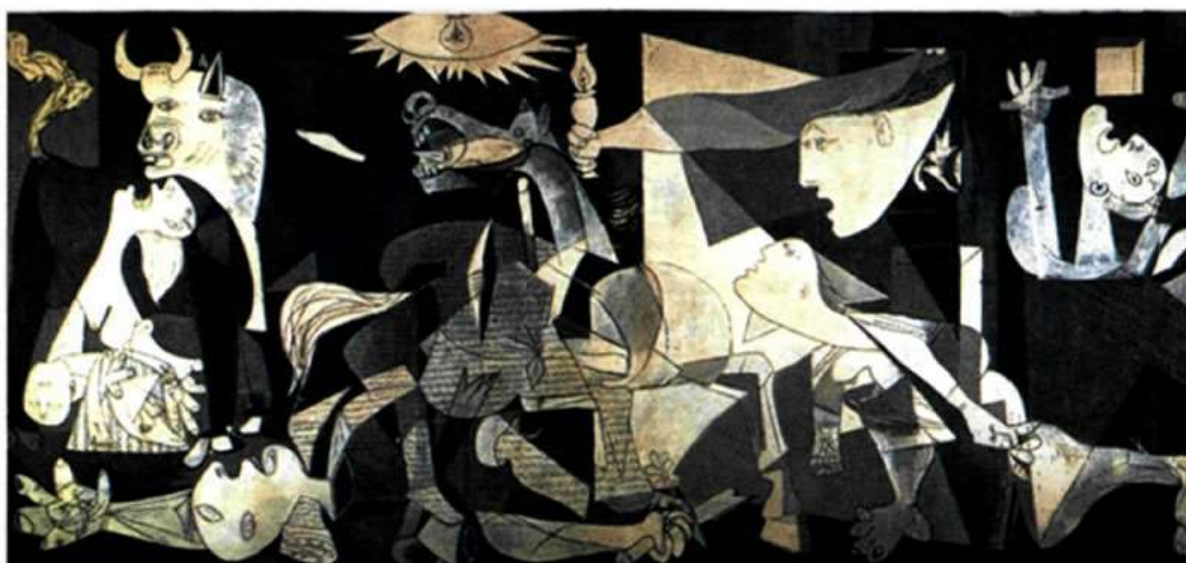
Γκουέρνικα, 1937, Πάμπλο Πικάσο (Pablo Picasso, 1881-1973)