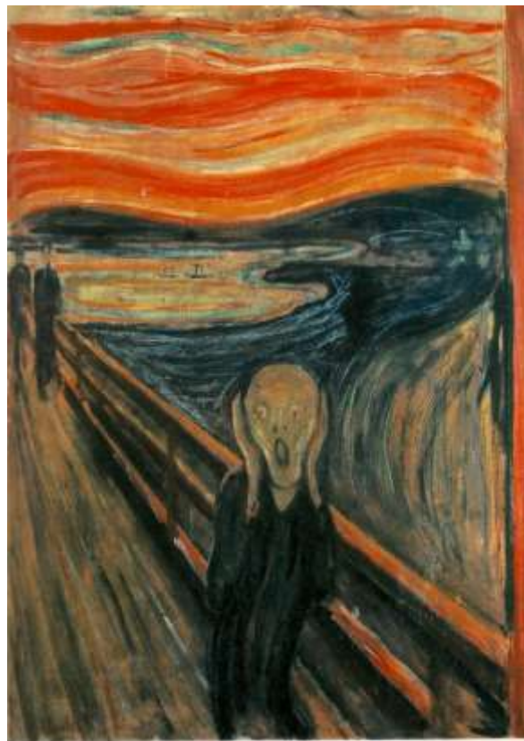
Η Κραυγή, 1893, Έντβαρτ Μουνκ (Edvard Munch, 1863 - 1944)