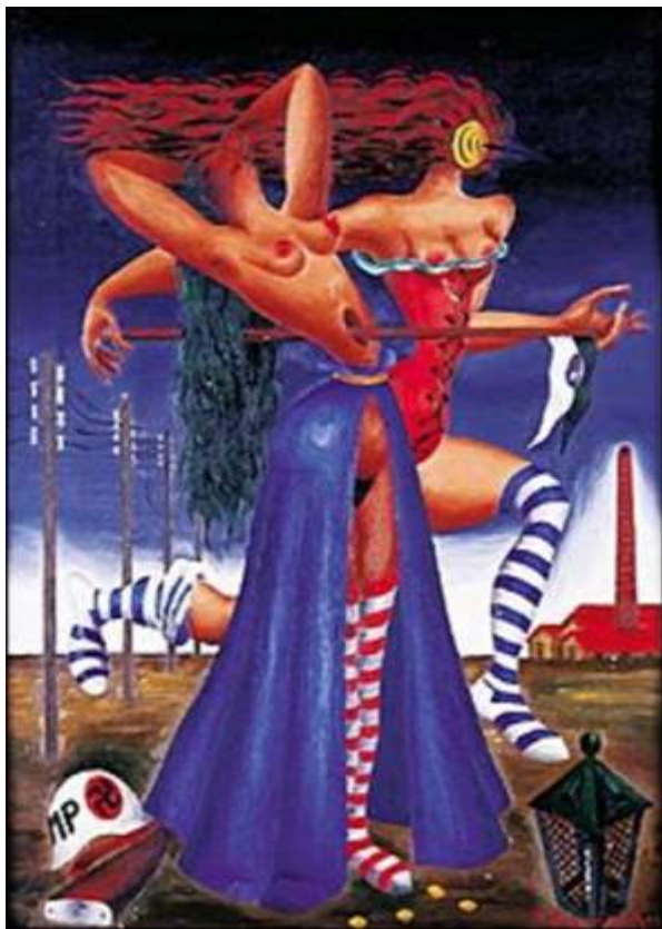
Εμφύλιος πόλεμος 1948 (Νίκος Εγγονόπουλος, 1907-1985)