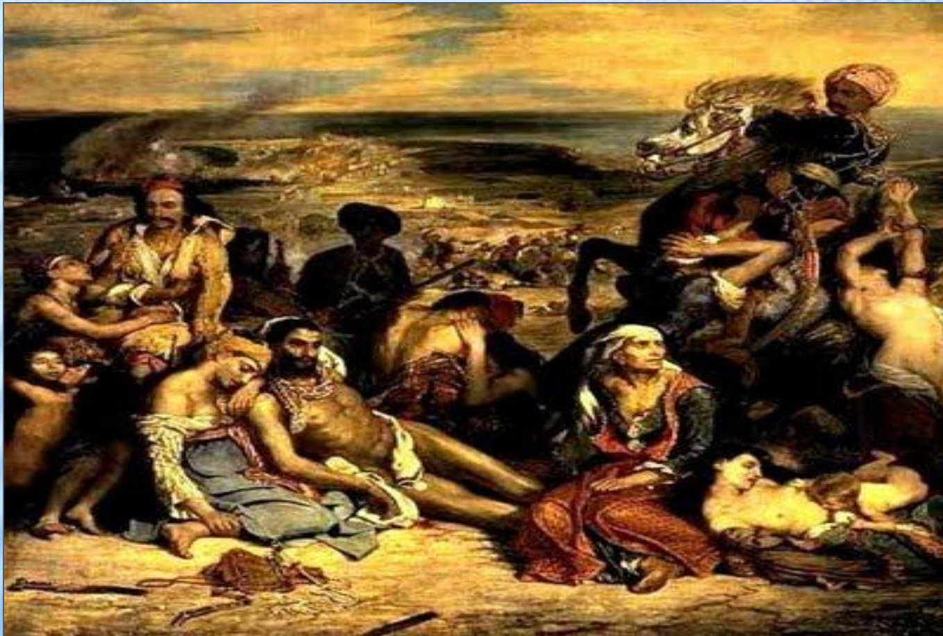
Ευγένιος Ντελακρουά, «Η σφαγή της Χίου», 1824, Μουσείο του Λούβρου, Παρίσι