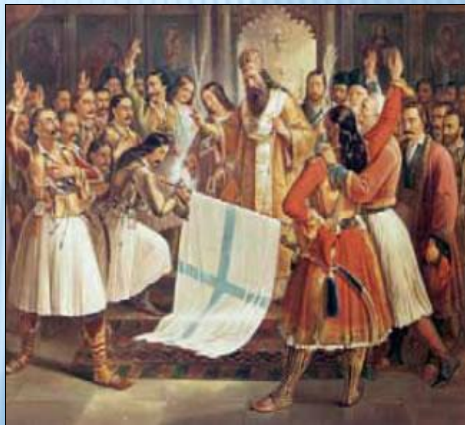
Θεόδωρος Βρυζάκης, «Ο Παλαιών Πατρών Γερμανός ευλογεί τη σημαία της επανάστασης (φανταστική σύνθεση)», 1865, Εθνική Πινακοθήκη Ελλάδας