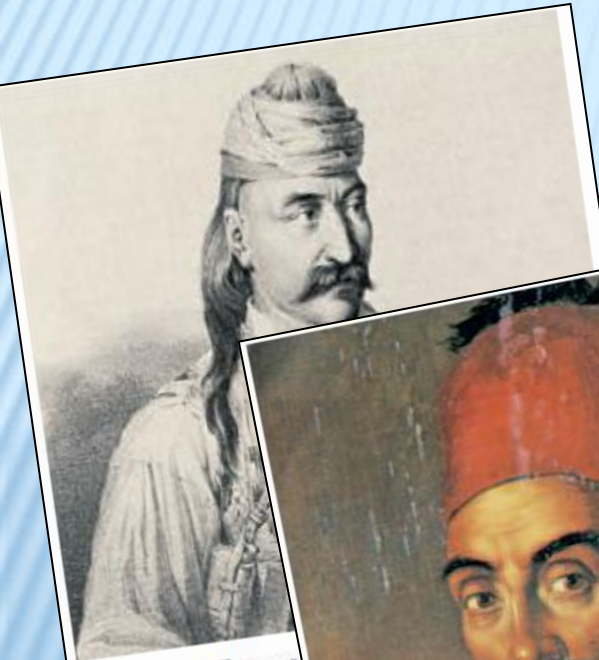
2. Ο Θεόδωρος «γέρος του Μοριά» επανάστασης

Προσωπογραφίες πρωταγωνιστών της Ελληνικής Επανάστασης (σχολικό εγχειρίδιο, σ. 30-32)