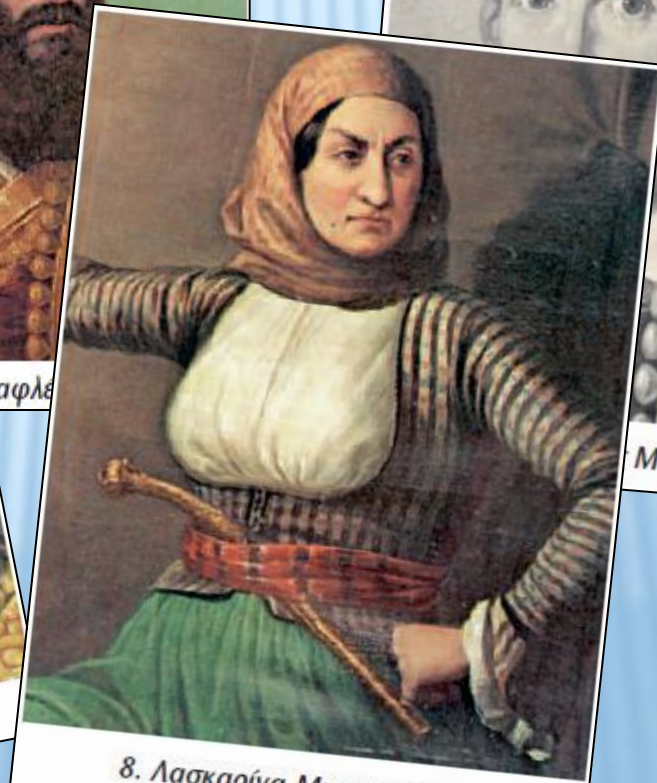
8. Λασκαρίνα Μπουμπουλίνα