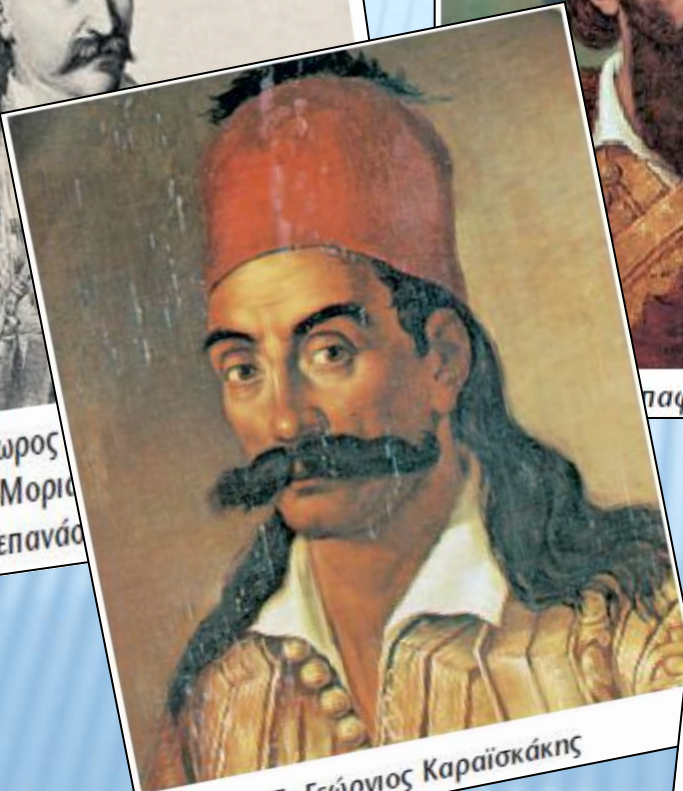
7. Γεώργιος Καραϊσκάκης