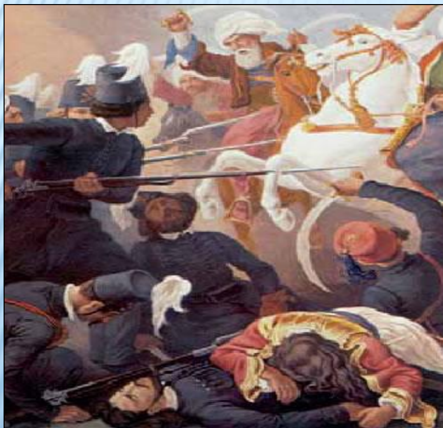
Πέτερ φον Ες, «Ο Ιερός Λόχος μάχεται στο Δραγατσάνι», 2ο μισό 19ου αιώνα, Μουσείο Μπενάκη, Αθήνα