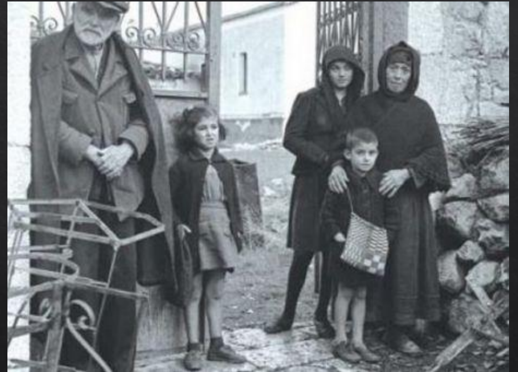
Δίστομο 1944, μετά τη σφαγή