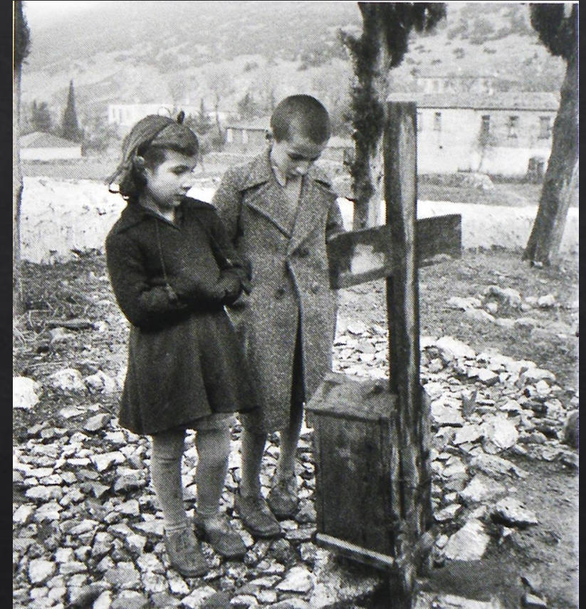
Νεκροταφείο Διστόμου 1945