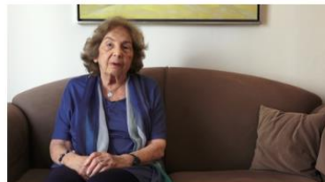
Ζέτη, Άλκη 01 h 38 min Καθημερινότητα, Αντίσταση