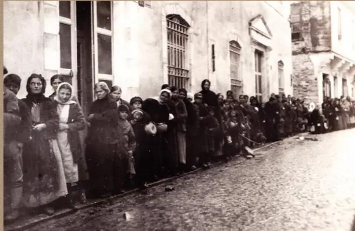
Καβάλα: η λεγόμενη «γραμμή του ψωμιού», Βουλγαρική Κατοχή, 1914-1919

Για τις επιβαρυνμένες περιοχές της Μακεδονίας και της Θράκης, καταλυτικές υπήρξαν οι τραυματικές εμπειρίες από τους εθνικούς ανταγωνισμούς και τις διεκδικήσεις, από τους Βαλκανικούς Πολέμους, τον Εθνικό Διχασμό, την βουλγαρική κατοχή στην Ανατολική Μακεδονία και Θράκη, από την εμπλοκή στον Μεγάλο Πόλεμο και στον Μικρασιατικό Πόλεμο και κυρίως από τη Μικρασιατική Καταστροφή και την Ανταλλαγή Πληθυσμών με όλα όσα επακολούθησαν στην «ειρηνική» περίοδο του Μεσοπολέμου. Τέλος, στο επίπεδο των ιδεολογιών και των κοινωνικών κινημάτων, στη δεκαετία του 1930 ο αντικομμουνισμός καθίσταται δομικό συστατικό της κυρίαρχης ιδεολογίας και κινητήρια δύναμη των κρατικών μηχανισμών καταστολής των εργατικών διεκδικήσεων.