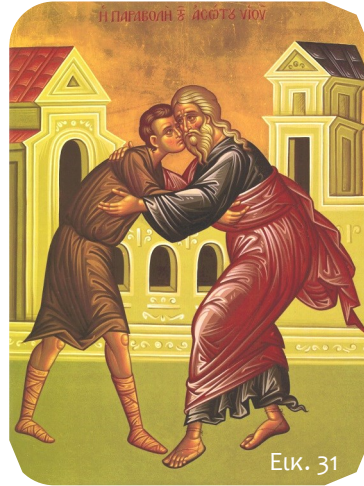
Ο άσωτος υιός