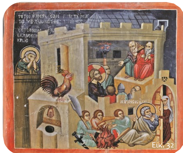
Η άρνηση του Πέτρου