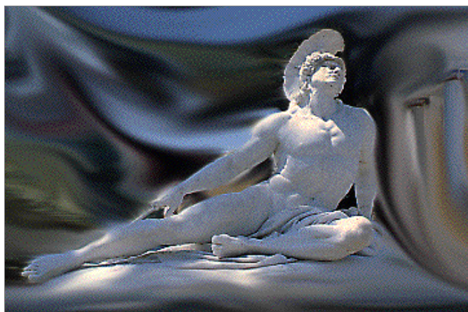
Εικ. 10 Ο Αχιλλέας "Θνήσκων". Από το Αχιλλείο στην Κέρκυρα

Για ήρωες όπως ο Αχιλλέας (και ο Οδυσσεύς) η εμπειρία της ζωής αποκτά νόημα μόνο μέσα από τον θάνατο. Ο Αχιλλέας βλέπει τον γερο-βασιλιά να ταπεινώνεται μπροστά του, ο Οδυσσεύς στέκεται μπροστά στη θεά που του προσφέρει αθανασία. Και οι δύο κατανοούν ότι η αδυναμία του ανθρώπου είναι αυτή ακριβώς που καθιστά τη ζωή το πιο σημαντικό αγαθό. Η αθανασία στερεί τη δυνατότητα να βιώσει κανείς την ουσία και μοναδική αξία της ζωής. Στην Ιλιάδα κανένας ήρωας δεν κερδίζει την αθανασία. Αυτή η πιθανότητα απουσιάζει εντελώς. Στην Αιθιοπίδα 20 η Ηώς ζητά και παίρνει την αθανασία του γιου της Μέμνονα. Στην Ιλιάδα η Θέτιδα δε σκέφτεται ποτέ να κάνει αθάνατο τον γιο της. Αυτό που ζητά είναι η ευκαιρία να γίνει ο Αχιλλέας ο ήρωας της Ιλιάδας . Ο ποιητής δεν τονίζει την αθανασία της Θέτιδας αλλά τη σύντομη ζωή του Αχιλλέα. Προβάλλει τα όρια της ανθρώπινης ζωής από τα οποία δε διαχωρίζεται το ηρωικό ιδεώδες.