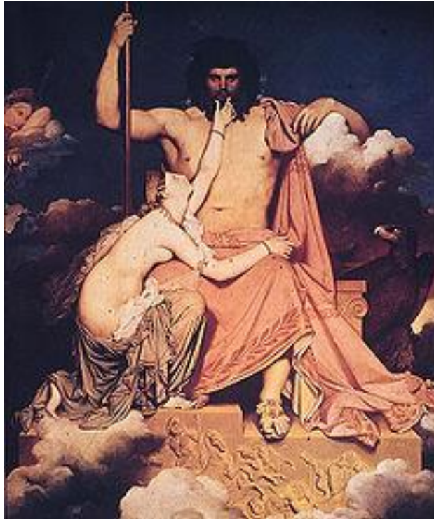
Εικ. 7 Jean Auguste Dominique Ingres (1780-1867) Δίας και Θέτιδα

Καθώς η Θέτιδα ακούει τον θρήνο του Αχιλλέα βγαίνει από τη θάλασσα με τη συνοδεία των άλλων Νηρηίδων και σπεύδει κοντά του. Η άφιξή της παραπέμπει ευθέως στην πρώτη παρουσία της κοντά στον Αχιλλέα στη ραψωδία Α (για παράδειγμα πρβλ. Σ 73 με Α 362-3). Η τραγική κατάσταση στην οποία βρίσκεται τώρα ο γιος της είναι συνέπεια εκείνης της πρώτης άφιξης. Ζήτησε από τον Δία να τιμήσει τον γιο της και η υλοποίηση εκείνης της επιθυμίας είχε τραγικές συνέπειες. Αυτή τη φορά ο Αχιλλέας δεν ζητά τίποτε από τη μητέρα του (καμιά υπόσχεση, καμιά βοήθεια), παίρνει την κατάσταση στα χέρια του. Είναι η Θέτιδα που ζητά από τον Ήφαιστο να του κατασκευάσει καινούργια όπλα, παρόλο που γνωρίζει ότι αυτό θα οδηγήσει στον θάνατο του Αχιλλέα. Για μια ακόμα φορά (όπως και στη ραψωδία Α) η παρουσία της Θέτιδας λειτουργεί ως υπόμνηση του θανάτου 15 του Αχιλλέα! Η Θέτιδα φωτίζει τη θνητότητα του Αχιλλέα, αν και η ίδια είναι αθάνατη.