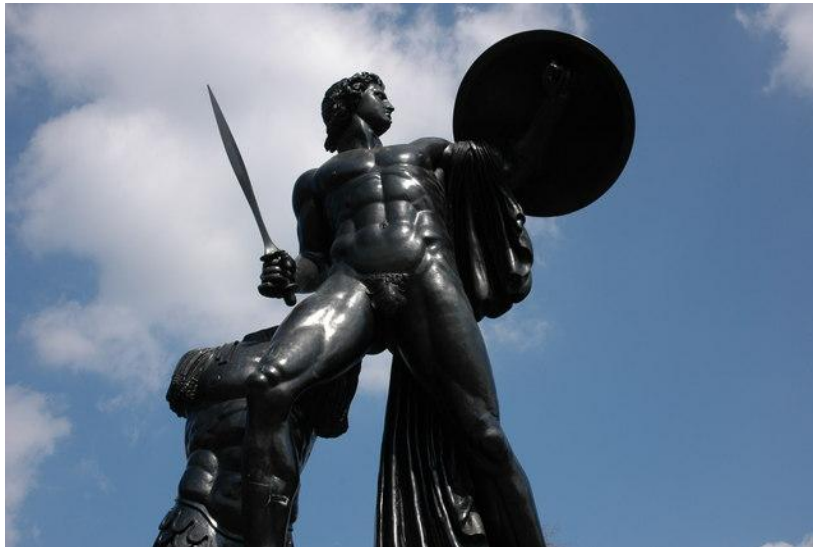
Εικ. 5 Sir Richard Westmacott Άγαλμα του Αχιλλέα στο Hyde Park

που ταυτίζεται με τη μοίρα του (Σ 116). Συμφιλιώνεται πλήρως με τον θάνατο, τον οποίο δεν απέφυγε ούτε ο Ηρακλής 9 (ο μόνος με τον οποίο μπορεί να συγκριθεί ο Αχιλλέας). Ο θάνατός του όμως θα συνδεθεί με λαμπρή και άφθαρτη δόξα (κλέος έσθλόν, Σ 126 και κλέος άφθιτον I 413). Θα πάρει εκδίκηση. Ο μεγάλος λόγος του Αχιλλέα εκτόνωσε τον πόνο και επιτρέπει τώρα στον ήρωα να προβάλλει την απειλητική του αγριότητα. Δεν παρουσιάζει την καταστροφή που θα προκαλέσει στους Τρώες μέσα από τους νεκρούς άνδρες, αλλά μέσα από τον πόνο των γυναικών γι' αυτούς. Ο Αχιλλέας γίνεται διπλά άπρονος. Ο μεγάλος πόνος του Αχιλλέα τον οδηγεί μέσα από τη θλίψη, την αυτοκριτική και τον αναστοχασμό στην εκδικητική μανία. Όπως παρατηρεί ο Schein (1984, 136) στους στίχους Σ 120-6 σημειώνεται η πλήρης αλλαγή του Αχιλλέα. Βλέπει τον εαυτό του ως πολιορκητή της πόλης της Τροίας και έχει πλήρη συναίσθηση του πόνου που θα προκαλέσει. Εκεί λειτουργεί μια αντεστραμμένη φιλότιτα : βλέπει και κατανοεί την κατάσταση των άλλων, τον πόνο που τους προκαλεί λόγω της μήνιος , αλλά γίνεται ακόμα πιο σκληρός, ακόμα πιο απάνθρωπος. Σε ό,τι ακολουθεί γίνεται δαιμονικός.