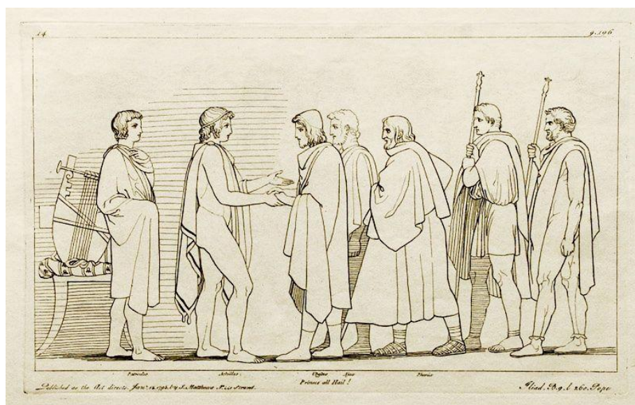
Εικ. 6 Tommaso Piroli (1752 – 1824) βασισμένο σε σχέδιο του John Flaxman (1755 – 1826) Η πρεσβεία των Αχαιών στον Αχιλλέα

Ο Arieti (1985, 194) χωρίς να απορρίπτει τις απόψεις του Doods (που γενικά έχουν ευρεία αποδοχή) προχωρά ένα βήμα πιο πέρα και παρατηρεί ότι στον Όμηρο σημειώνεται η μετάβαση από τον "πολιτισμό της ντροπής" στον "πολιτισμό της ενοχής" και αυτό συντελείται στο πρόσωπο του Αχιλλέα . Η διανοητική και ηθική ταραχή που δοκιμάζει ο Αχιλλέας αποτελεί τον ηθικό πυρήνα της Ιλιάδας . Ο Αχιλλέας ανακαλύπτει για τον δυτικό κόσμο την ενοχή και φτάνει στον ηθικό ηρωισμό, που τον εξυψώνει πάνω από όλους τους άλλους Έλληνες πολεμιστές 11 .