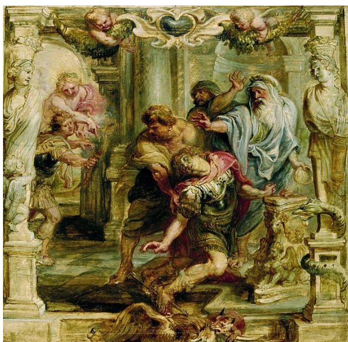
Εικ. 4 Peter Paul Rubens (1577- 1640) Ο θάνατος του Αχιλλέα (1630-1635) Μουσείο Boijmans Van Beuningen

της τέκνον, τί κλαίεις; (Σ 73) και συνεχίζει τὰ μὲν δὴ τοι τετέλεσται/ ἐκ Διός, ὡς ἄρα δὴ πρὶν γ' εὖχεο χεῖρας ἀνασχών (74-5). Η απάντηση του Αχιλλέα εκφράζει την πλήρη μεταστροφή του: ἀλλὰ τί μοι τῶν ἦδος ἐπεὶ φίλος ὤλεθ' ἐταῖρος/ Πάτροκλος, τὸν ἐγὼ περὶ πάντων τῶν ἐταίρων/ ἴσον ἐμῇ κεφαλῇ; τὸν ἀπώλεσα (Σ 80-2). Ποιο το ὄφελος; Χάθηκε ο Πάτροκλος. Εύχεται να μην είχε γίνει ποτέ ο γάμος της Θέτιδας με τον Πηλέα 6 , δηλαδή να μην είχε γεννηθεί ποτέ (Σ 86-7). Ξέρει το τέλος του (Σ 88) και συνεχίζει: ἐδὼ και τώρα ας πεθάνω, αφού δεν μπόρεσα τον φίλο μου/ μπροστά στον θάνατο να τον γλιτώσω (Σ 98-99). Ο Αχιλλέας έχει συνειδητοποιήσει το αληθινό νόημα της τιμής, που δε συνδέεται πια με τα υλικά αγαθά και την κοινωνική καταξίωση. Η πληγωμένη του τιμή τον έβγαλε από τη μάχη, η επιδίωξη του κλέους θα τον επαναφέρει. Το τίμημα θα είναι η ίδια του η ζωή.