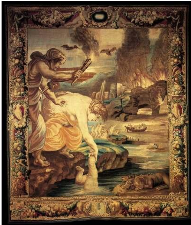
Εικ. 9 Peter_Paul_Rubens (1577-1640) Η Θέτιδα βυθίζει τον Αχιλλέα στα νερά της Στύγας Βρυξέλλες, Koninklijke Musea voor Kunst en Geschiedenis