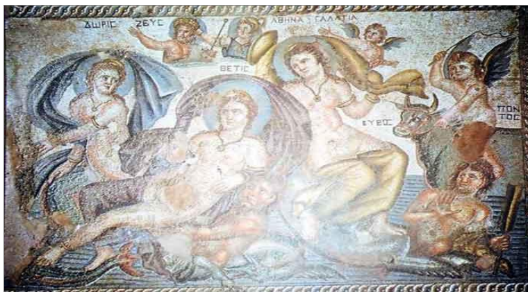
Εικ. 8 Θέτιδα και Νηρηίδες. Ψηφιδωτό από τον οίκο του Αιώνα στην Πάφο. 4ος αιώνας μ.Χ.

Καθώς η Θέτιδα ακούει τον θρήνο του Αχιλλέα βγαίνει από τη θάλασσα με τη συνοδεία των άλλων Νηρηίδων και σπεύδει κοντά του. Η άφιξή της παραπέμπει ευθέως στην πρώτη παρουσία της κοντά στον Αχιλλέα στη ραψωδία Α (για παράδειγμα πρβλ. Σ 73 με Α 362-3). Η τραγική κατάσταση στην οποία βρίσκεται τώρα ο γιος της είναι συνέπεια εκείνης της πρώτης άφιξης. Ζήτησε από τον Δία να τιμήσει τον γιο της και η υλοποίηση εκείνης της επιθυμίας είχε τραγικές συνέπειες. Αυτή τη φορά ο Αχιλλέας δεν ζητά τίποτε από τη μητέρα του (καμιά υπόσχεση, καμιά βοήθεια), παίρνει την κατάσταση στα χέρια του. Είναι η Θέτιδα που ζητά από τον Ήφαιστο να του κατασκευάσει καινούργια όπλα, παρόλο που γνωρίζει ότι αυτό θα οδηγήσει στον θάνατο του Αχιλλέα. Για μια ακόμα φορά (όπως και στη ραψωδία Α) η παρουσία της Θέτιδας λειτουργεί ως υπόμνηση του θανάτου 15 του Αχιλλέα! Η Θέτιδα φωτίζει τη θνητότητα του Αχιλλέα, αν και η ίδια είναι αθάνατη.