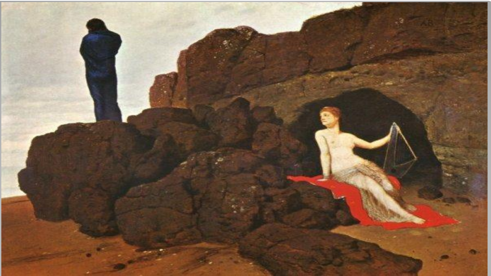
Arnold Böcklin, Odysseus and Calypso