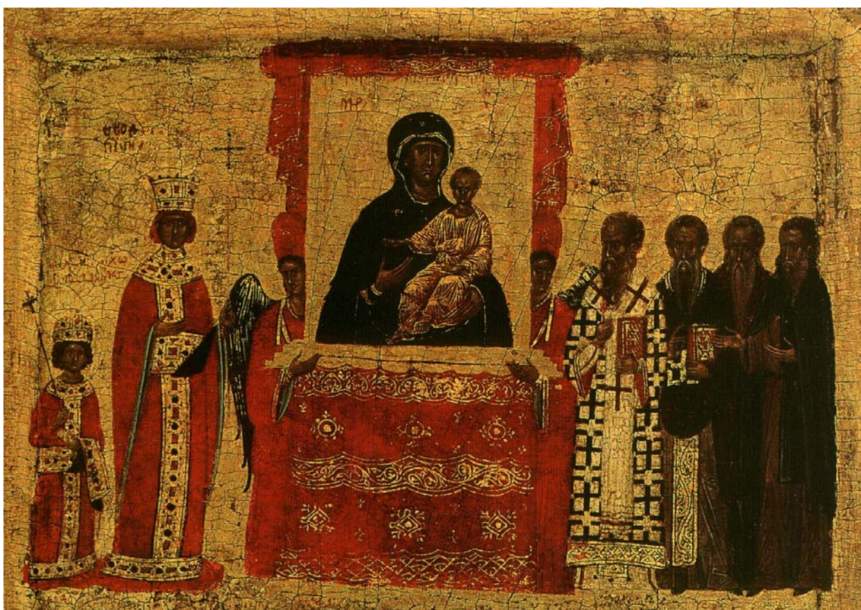
Αναστήλωση των εικόνων, άνω ζώνη φορητής εικόνας, τέλη 14ου αιώνα, Λονδίνο, British Museum

ii. Με ποια μεγάλη εκκλησιαστική γιορτή συνδέεται το γεγονός αυτό; Τι κάνουν οι πιστοί στη συγκεκριμένη γιορτή στην εκκλησία; (Συμβουλευθείτε το θεολόγο του σχολείου σας, τον ιερέα της κοινότητάς σας και τους γονείς σας).