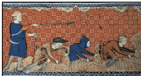
Δουλοπάροικοι στη φεουδαρχική Αγγλία, αρχές 14 ου αιώνα