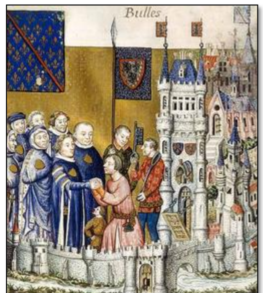
Όρκος υποτελείας του κόμη του Κλερμόν, από χειρόγραφο του 14 ου αιώνα