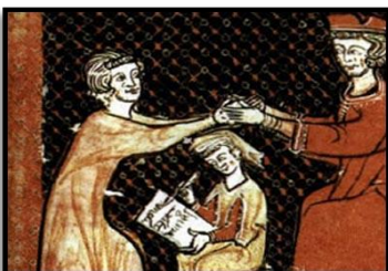
Ο όρκος πίστης και υποταχής Μικρογραφία του 13 ου αιώνα

II. Ο φεουδάρχης: ονομαζόταν ο ιδιοκτήτης του φέουδου.