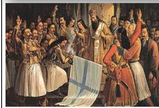
«Ο Παλιών Πατρών Γερμανός ευλογεί τη σημαία της Επανάστασης» το 1821. Πίνακας του Θεόδωρου Βρυζάκη (1865). Αθήνα, Εθνική Πινακοθήκη