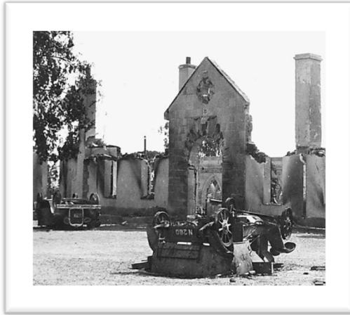
Το Κυβερνείο στη Λευκωσία μετά τον εμπρησμό του, Οκτώβριος 1931