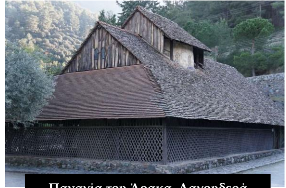
Παναγία του Άρακα, Λαγουδερά

Χαρακτηριστικά των μορφών: πανύψηλες κορμοστασιές, εφηβικά και ήρεμα πρόσωπα, λεπτά υφάσματα με περίτεχνη πτυχολογία, ορμητική κίνηση, καθαρό και σίγουρο σχέδιο.