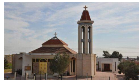
Εκκλησία Αγίου Μάρωνα, Ανθούπολη