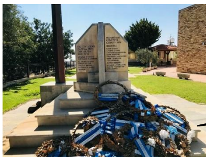
Μαρμάρινο μνημείο Πεσόντων και Αγνοουμένων Μαρωνιτών (προαύλιο της εκκλησίας του Αγίου Μάρωνα στην Ανθούπολη), Λευκωσία