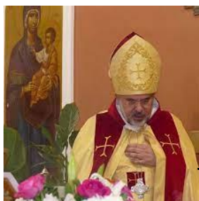
Ο αρχιεπίσκοπος των Μαρωνιτών Κύπρου