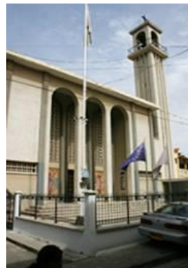
Ο Μαρωνιτικός καθεδρικός ναός της Παναγίας των Χαριτών, Λευκωσία