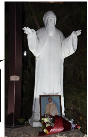
Το άγαλμα του Αγίου Σιάρπελ στο προαύλιο της ομώνυμης εκκλησίας στη Λεμεσό