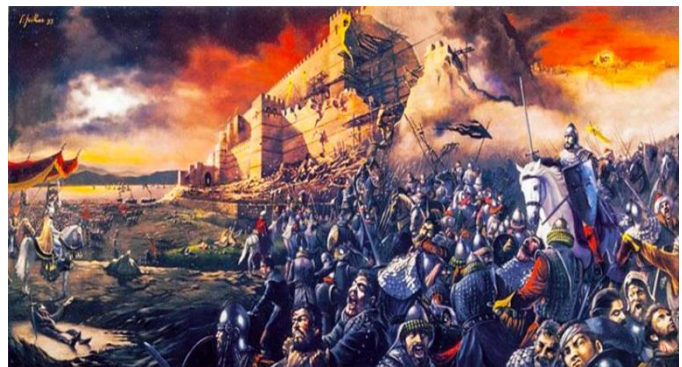
Ελένη Θεολόγου, φιλόλογος