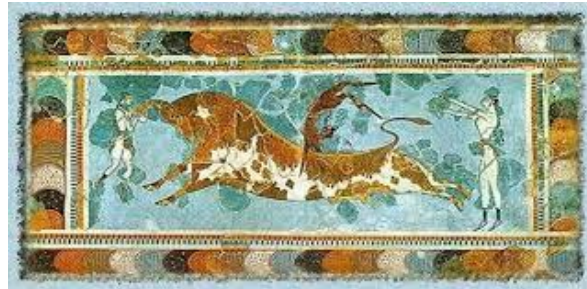
«ΤΑΥΡΟΚΑΘΑΨΙΑ» ΤΟΙΧΟΓΡΑΦΙΑ ΑΠΟ ΤΗΝ ΚΝΩΣΟ