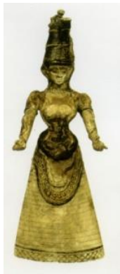
Η ΜΕΓΑΛΗ ΘΕΑ ΤΩΝ ΟΦΕΩΝ