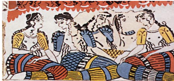
ΤΟΙΧΟΓΡΑΦΙΑ ΙΕΡΟΥ ΑΠΟ ΤΗΝ ΚΝΩΣΟ