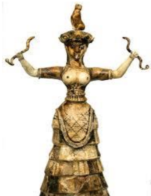
Η ΜΙΚΡΗ ΘΕΑ ΤΩΝ ΟΦΕΩΝ