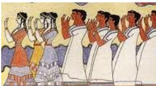
ΤΟΙΧΟΓΡΑΦΙΑ ΠΟΜΠΗΣ ΑΠΟ ΤΗΝ ΚΝΩΣΟ