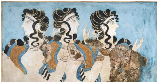
ΤΟΙΧΟΓΡΑΦΙΑ «ΓΑΛΑΖΙΕΣ ΚΥΡΙΕΣ» ΑΠΟ ΤΗΝ ΚΝΩΣΟ