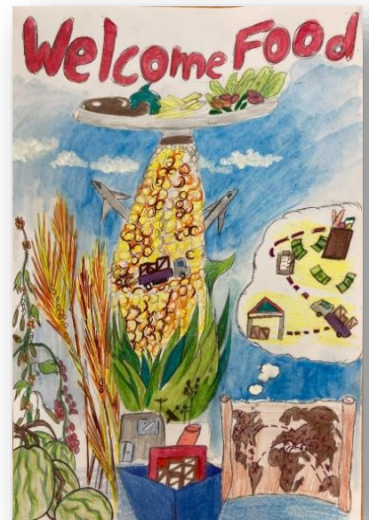
Συμεού Παρασκευή Ελεονώρα