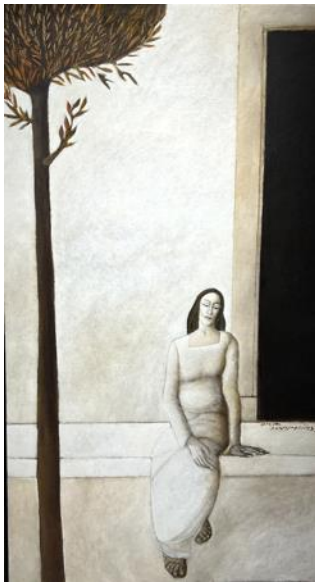
Το μυθικό μου ταξίδι 11, λάδι σε λινό, 90X160 εκ.