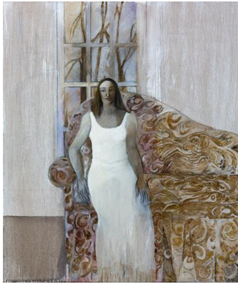
Το μυθικό μου ταξίδι 21, λάδι σε λινό, 120X140 εκ.