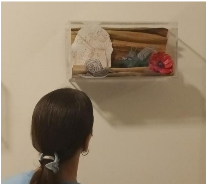
Τα τελικά έργα

Το σχολείο συμπληρώνει 100 χρόνια λειτουργίας τη συγκεκριμένη σχολική χρονιά και οι συνθέσεις των παιδιών αποτελούν έναν φόρο τιμής προς το σχολείο τους.