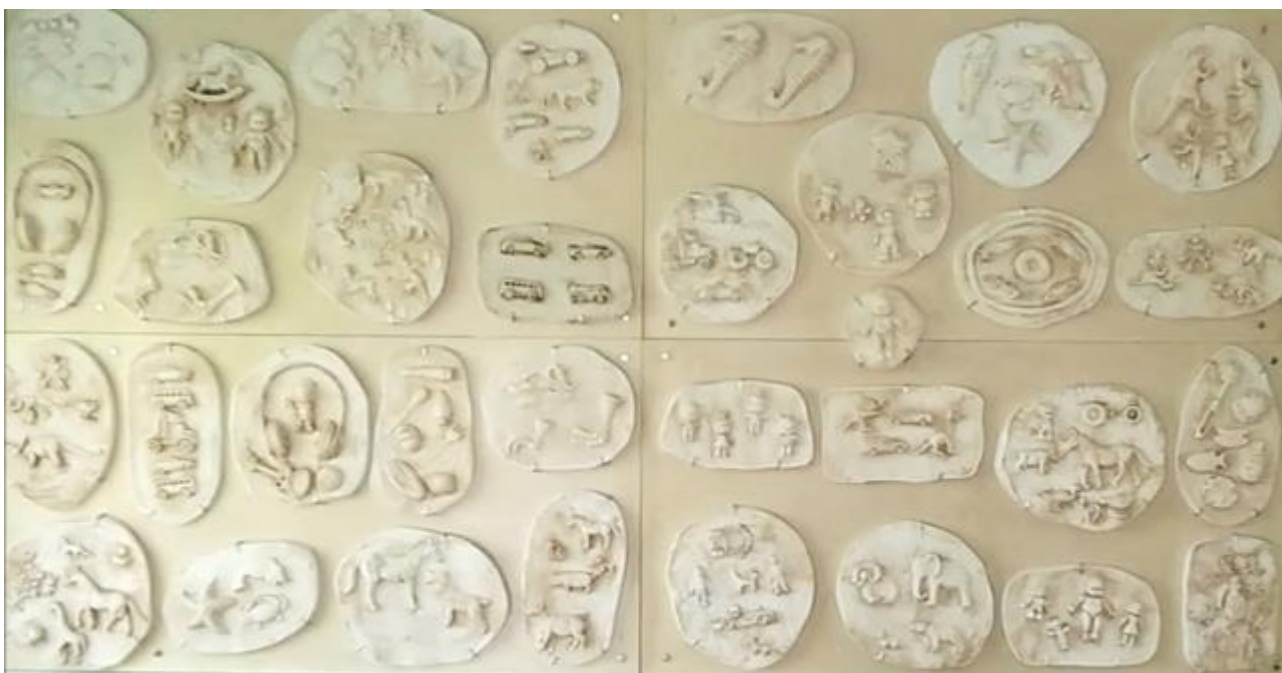
Έργο των παιδιών στον προθάλαμο του σχολείου

Σχολείο: Δημοτικό Σχολείο Λεμεσού ΚΓ' - Αγίου Σπυρίδωνα Β'