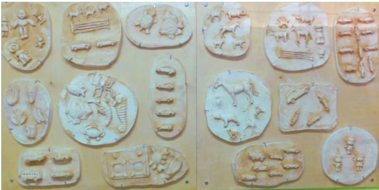
Έργο των παιδιών στο γραφείο της διεύθυνσης του σχολείου

Τα παιδιά συζητούν τρόπους προβολής του έργου και του μηνύματος που θέλουν να στείλουν. Αποφασίζουν να εκθέσουν τα συλλογικά τους έργα σε εσωτερικούς χώρους του σχολείου.