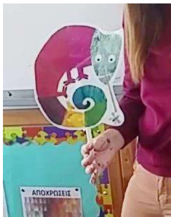
Η εκπαιδευτικός χρησιμοποιεί τη μασκότ - χαμαιλέοντα του Eric Carle για την έναρξη του μαθήματος

Η/Ο εκπαιδευτικός χρησιμοποιεί τη μασκότ - χαμαιλέοντα του Eric Carle (βλ. παράρτημα 3) για την έναρξη του μαθήματος. Ο χαμαιλέοντας «λέει» στα παιδιά πόσο πολύ του άρεσε ο τρόπος που εργάστηκαν καθώς και πόσο του θύμισε κάποιους φίλους του από το ζωολογικό κήπο. Όμως, για να τους δείξει τι του θύμισαν, θα παίξει μαζί τους ένα παιχνίδι.