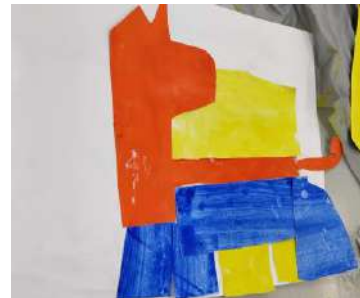
Παραδείγματα από πειραματισμούς των παιδιών με τα χαρτιά που δημιούργησαν και τα κομμάτια των ζώων που τους δόθηκαν από την εκπαιδευτικό