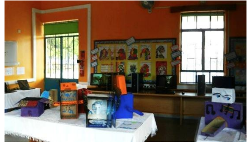
Πανοραμική φωτογραφία της έκθεσης

Κατά τη διάρκεια της έκθεσης προβαλλόταν βίντεο με φωτογραφίες από την πορεία εργασίας της ενότητας σε όλες της τάξεις.