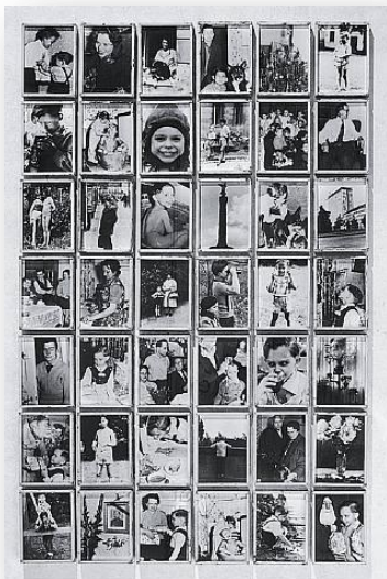
“Το φωτογραφικό άλμπουμ της οικογένειας Β” Christian Boltanski, 1991 Εγκατάσταση

Παρουσιάζονται στα παιδιά έργα καλλιτεχνών και παιδιών από διάφορα μέρη του κόσμου με θέμα την ταυτότητα. Τα παιδιά προβληματίζονται σε σχέση με διαφορετικούς τρόπους εικαστικής δημιουργίας με στόχο την ανάδειξη σημαντικά στοιχεία του εαυτού τους.