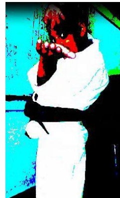
Έργα παιδιών (ψηφιακά τροποποιημένες φωτογραφίες)