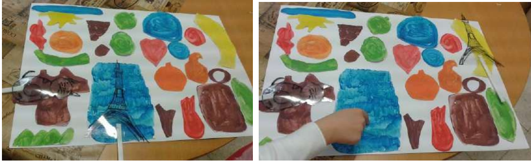
Το παιδί επιλέγει μια φιγούρα και την ταξιδεύει όπου θέλει στα έργα

Σημείωση: Όταν ολοκληρωθεί η ενότητα οι φιγούρες τοποθετούνται σε κουτί δίπλα από τα έργα σε κάποιο σημείο της τάξης. Τα παιδιά αν επιθυμούν παίζουν αυτό το παιχνίδι στον ελεύθερο τους χρόνο.