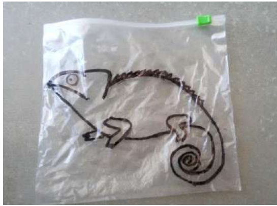
Η εκπαιδευτικός παρουσιάζει στα παιδιά ένα διάφανο σακουλάκι με σχεδιασμένο το περίγραμμα ενός χαμαιλέοντα

Τα παιδιά πειραματίζονται ελεύθερα στις ομάδες τους βάζοντας στα σακουλάκια τους ανά δύο όποια χρώματα θέλουν από τα βασικά. Όταν ολοκληρωθεί ο πειραματισμός, καλούνται να πουν τις παρατηρήσεις τους με βάση τα αποτελέσματα των αναμίξεών τους. Κάθε παιδί που ανακοινώνει την παρατήρησή του τοποθετεί στον πίνακα χρωματισμένα χαρτάκια με τα δύο βασικά χρώματα που ανάμιξε και το δευτερεύον π.χ. κόκκινο+κίτρινο=πορτοκαλί (πειραματισμός).