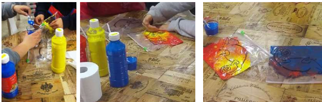
Τα παιδιά πειραματίζονται ελεύθερα στις ομάδες τους βάζοντας στα σακουλάκια τους ανά δύο όποια χρώματα θέλουν από τα τρία βασικά

Τα παιδιά πειραματίζονται ελεύθερα στις ομάδες τους βάζοντας στα σακουλάκια τους ανά δύο όποια χρώματα θέλουν από τα βασικά. Όταν ολοκληρωθεί ο πειραματισμός, καλούνται να πουν τις παρατηρήσεις τους με βάση τα αποτελέσματα των αναμίξεών τους. Κάθε παιδί που ανακοινώνει την παρατήρησή του τοποθετεί στον πίνακα χρωματισμένα χαρτάκια με τα δύο βασικά χρώματα που ανάμιξε και το δευτερεύον π.χ. κόκκινο+κίτρινο=πορτοκαλί (πειραματισμός).