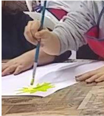
Το παιδί ζωγραφίζει ένα κίτρινο στοιχείο

Στο σημείο αυτό γίνεται επίδειξη από την/τον εκπαιδευτικό στον τρόπο καθαρισμού του πινέλου (καθάρισμα πινέλου σε νερό, σκούπισμα και στέγνωμα με χαρτί πριν τη χρήση του επόμενου χρώματος). (Επίδειξη από εκπαιδευτικό-ρουτίνα)