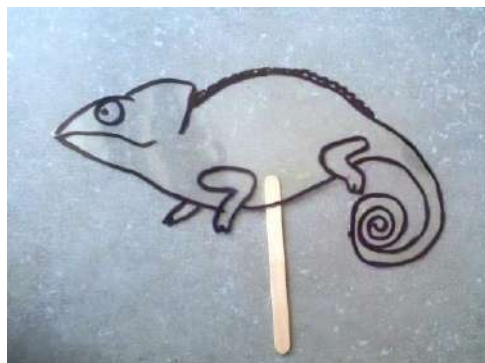
Χαμαιλέοντας σχεδιασμένος σε διαφάνεια

Τα παιδιά κάθονται σε ομάδες. Πάνω στα τραπέζια είναι τοποθετημένα τρία πλαστικά ποτηράκια και μπουκάλια νερομπογιάς τέμπρας με τα τρία βασικά χρώματα. Η εκπαιδευτικός έχει τοποθετήσει ένα χαμαιλέοντα σχεδιασμένο σε διαφάνεια (παράρτημα 2) πάνω σε ένα αντικείμενο βασικού χρώματος π.χ. κόκκινο (προετοιμασία ομάδων).