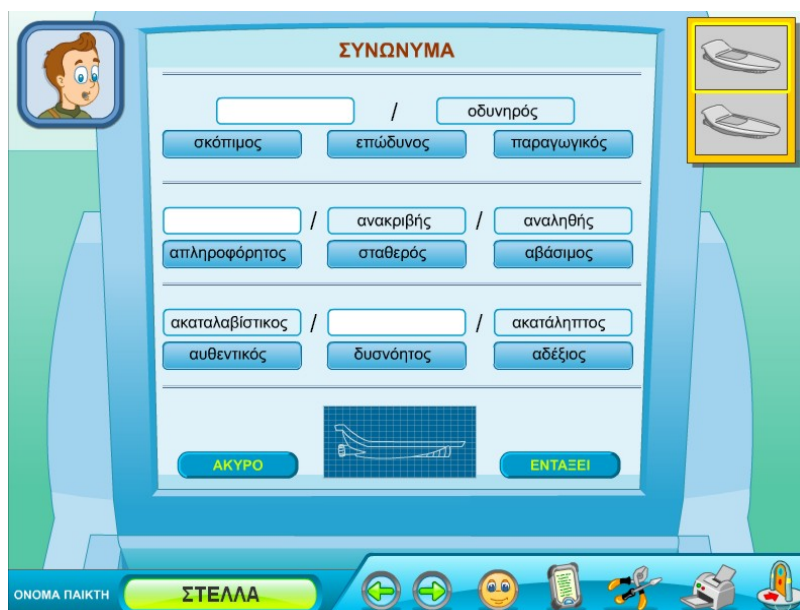
Παράδειγμα οθόνης δοκιμασίας

Έτσι, αν ο μαθητής δεν γνωρίζει τι πρέπει να κάνει προκειμένου να προχωρήσει στη δοκιμασία, μπορεί να επιλέξει τη συσκευή της γραμματικής ώστε να εμφανιστούν οι αντίστοιχοι κανόνες.