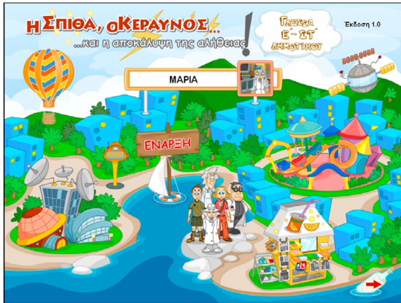
Κεντρική οθόνη προγράμματος

Από την «Κεντρική οθόνη» παρέχονται οι επιπλέον επιλογές: α) Παίκτης όπου ορίζεται ο τρέχων παίκτης ή εισάγεται νέος παίκτης, β) Ρυθμίσεις όπου γίνονται οι επιμέρους ρυθμίσεις που αφορούν στην ένταση του ήχου και το μέγεθος της οθόνης, γ) Σύνδεσμοι με χρήσιμες ηλεκτρονικές διευθύνσεις για το διαδίκτυο και δ) Έξοδος για την έξοδο από το πρόγραμμα.