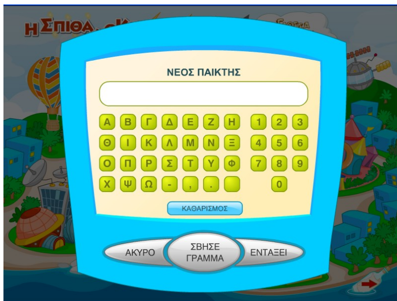
Οθόνη νέου παίκτη

Από την «Κεντρική οθόνη» παρέχονται οι επιπλέον επιλογές: α) Παίκτης όπου ορίζεται ο τρέχων παίκτης ή εισάγεται νέος παίκτης, β) Ρυθμίσεις όπου γίνονται οι επιμέρους ρυθμίσεις που αφορούν στην ένταση του ήχου και το μέγεθος της οθόνης, γ) Σύνδεσμοι με χρήσιμες ηλεκτρονικές διευθύνσεις για το διαδίκτυο και δ) Έξοδος για την έξοδο από το πρόγραμμα.