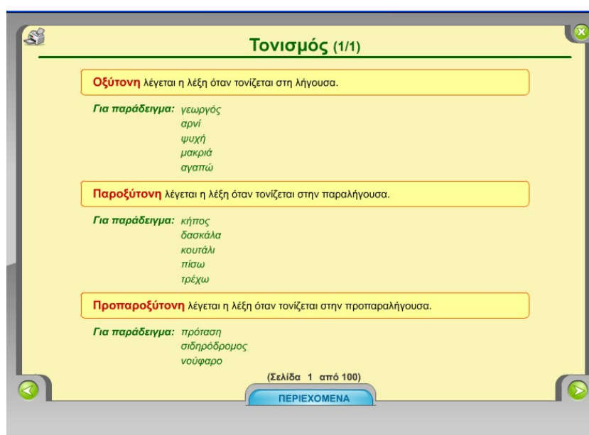
Παράδειγμα οθόνης από τη συσκευή της γραμματικής

Έτσι, αν ο μαθητής δεν γνωρίζει τι πρέπει να κάνει προκειμένου να προχωρήσει στη δοκιμασία, μπορεί να επιλέξει τη συσκευή της γραμματικής ώστε να εμφανιστούν οι αντίστοιχοι κανόνες.