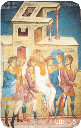
Ο έπαρχος Λεόντιος μεταφέρεται στον τάφο του Αγίου Δημητρίου, για να θεραπευτεί.

Μερικά χρόνια μετά τον θάνατο του Αγίου Δημητρίου, ένας νέος αυτοκράτορας, ο Μέγας Κωνσταντίνος, έδωσε εντολή να σταματήσουν οι διωγμοί * των χριστιανών. Ο κάθε πολίτης στην αυτοκρατορία του μπορούσε να πιστεύει στον Θεό χωρίς να φοβάται για τη ζωή του. Ενώ ως τότε οι χριστιανοί προσεύχονταν κρυφά μέσα στα σπίτια και σε υπόγειες σπηλιές, τώρα αρχίζουν να κτίζουν τους πρώτους ναούς.