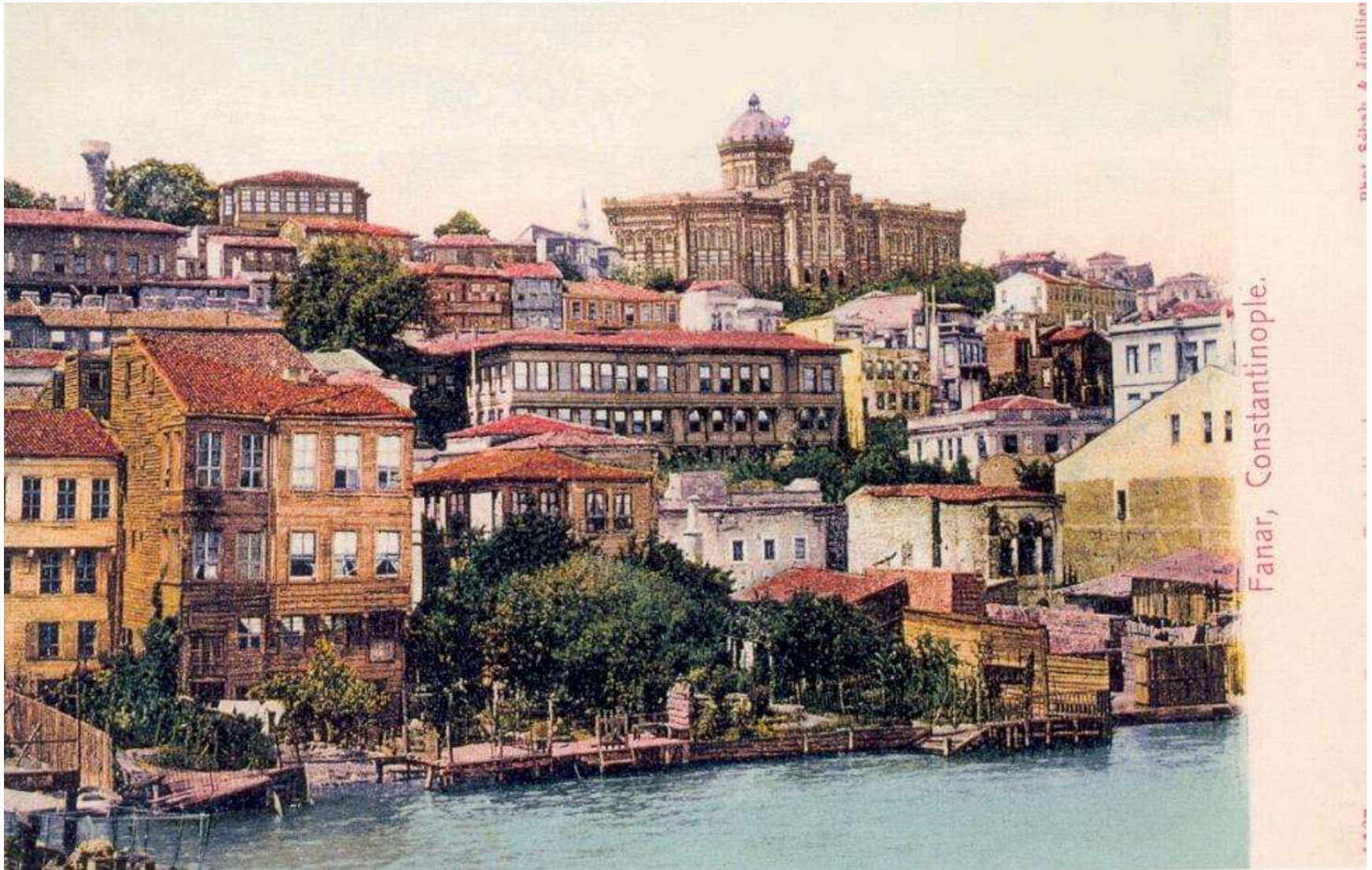
Post card του 1900, Φανάρι, Κωνσταντινούπολη