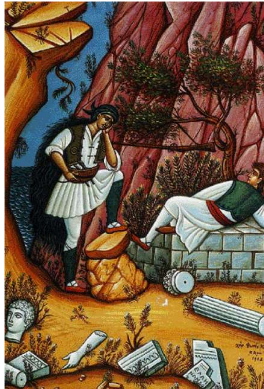
Φώτης Κόντογλου: «Άρματολοί και Κλέφτες», 1948