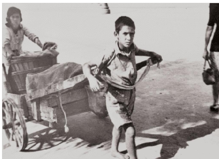
Π.2,Π.4, Π.5 & Π.6 Από την Εφημερίδα, «Η Καθημερινή», Περιοδικό 7 Ημέρες, Αφιέρωμα «Η Αθήνα της Κατοχής» 25/04/1999