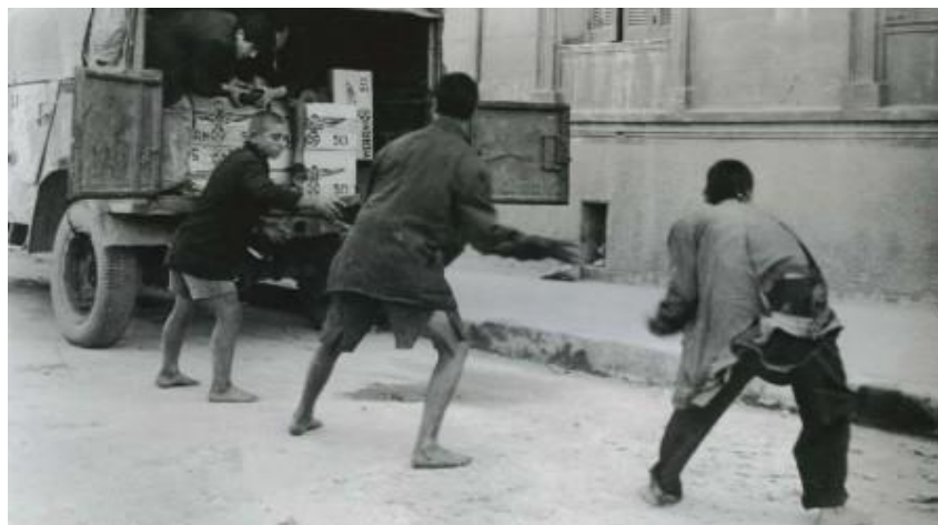
Σκηνή από την ταινία του Γκρεγκ Τάλας «Ξυπόλυτο Τάγμα», 1954.