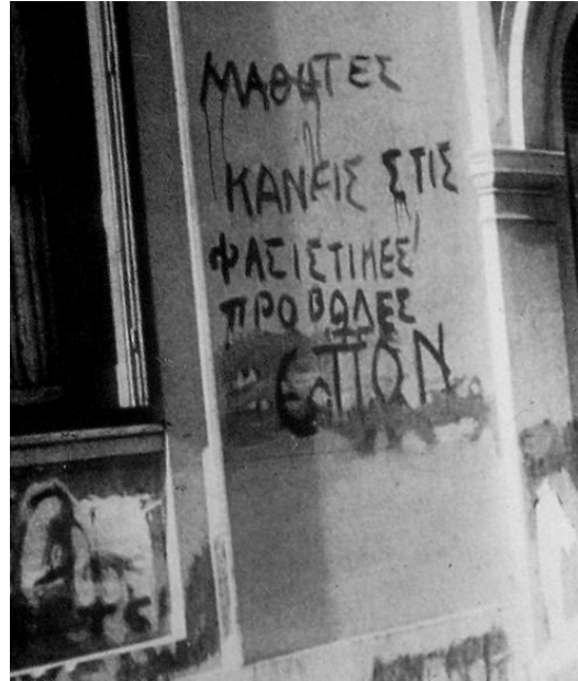
Συνθήματα σε τοίχο της κατοχικής Αθήνας