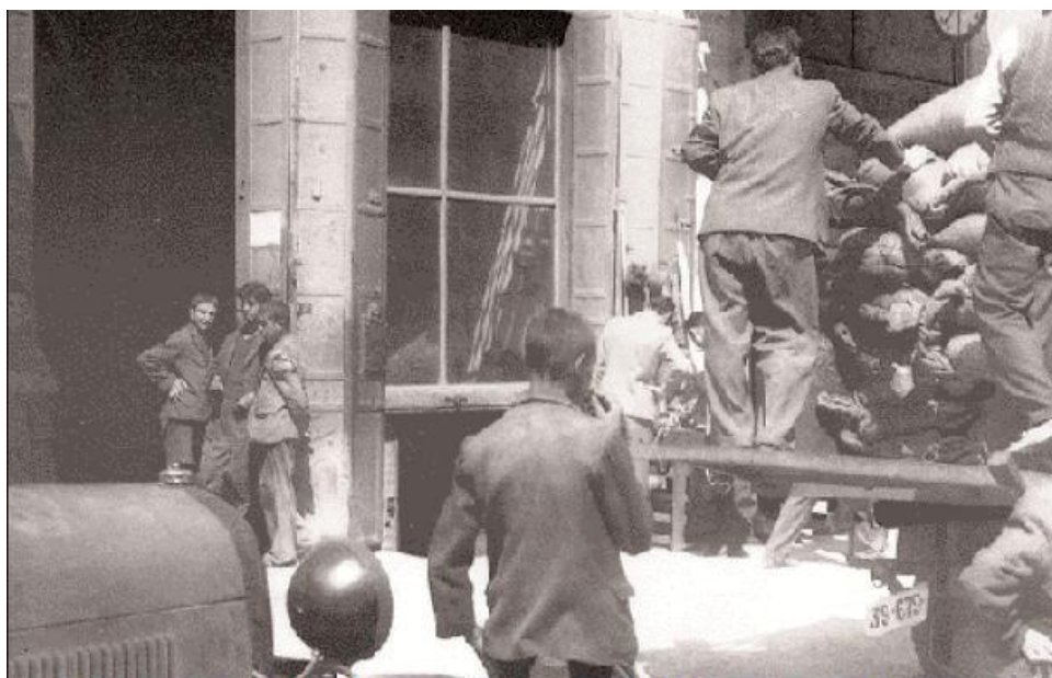
Κατοχική Αθήνα. Στην οδό Αθηνάς ένα καμιόνι ξεφορτώνει κάτι πολύτιμο, ίσως ένα φορτίο ρύζι. Γύρω караδοκούν... αδιάφορα οι μικροί σαλταδόροι, σχεδιάζοντας τις κινήσεις του αιφνιδισμού που ίσως τους αποφέρει κάποια πενιχρή λεία. Στην ισορροπία τρόμου της κατοχικής επιβίωσης, οι σαλταδόροι, τα μικρά παιδιά που πηδούσαν στα φορτηγά εν κινήσει για μια γρήγορη και επικίνδυνη λαφυραγωγία, ήταν ο πιο αδύναμος «εταίρος» στο παιχνίδι της ανάγκης – ο μαυραγορίτης, χορτασμένος και αδιάτακτος, βρισκόταν στο απολύτως αντίθετο άκρο. Φωτογραφία του Κώστα Παράσχου από το λευκίμα «Η Κατοχή», εκδ. Ί-Ερμής», Αθήνα 1997. Ο παλιμάχος δημοσιογράφος Κώστας Παράσχος, δουλεύοντας στη διάρκεια της Κατοχής στην εφημερίδα «Πρώτα» και έχοντας ταυτόχρονα το «χόμπι» της φωτογραφίας, τράβηξε από την κατοχική ζωή, ιδίως της Αθήνας (1941–1944), γύρω στις 850 φωτογραφίες. Σήμερα αποτελούν ένα ντοκουμέντο από τα θλιβερά εκείνα χρόνια.