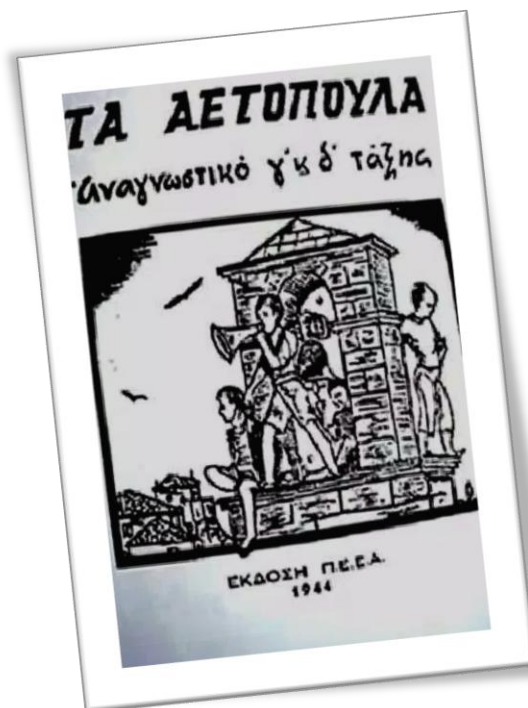
Εξώφυλλο του Αναγνωστικού της Π.Ε.Ε.Α. για τη Γ' & Δ' τάξη του Δημοτικού Σχολείου http://www.tovima.gr/politics/article/?aid=536759