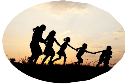
φίλοι και φίλες