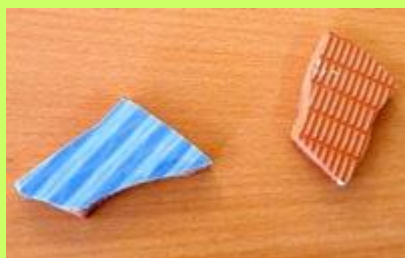
Σπασμένο Κεραμικό Πλακάκι (η πίσω πλευρά)