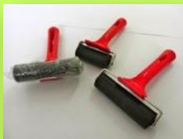
Κύλινδροι από Ελαστικό