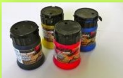
Μπογιές για Τύπωμα