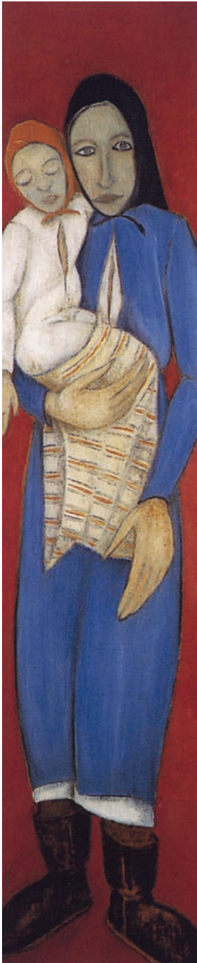
ΓΕΩΡΓΙΟΣ ΓΕΩΡΓΙΟΥ, Η Παναγία του Λιοπετρίου , λάδι, 1952