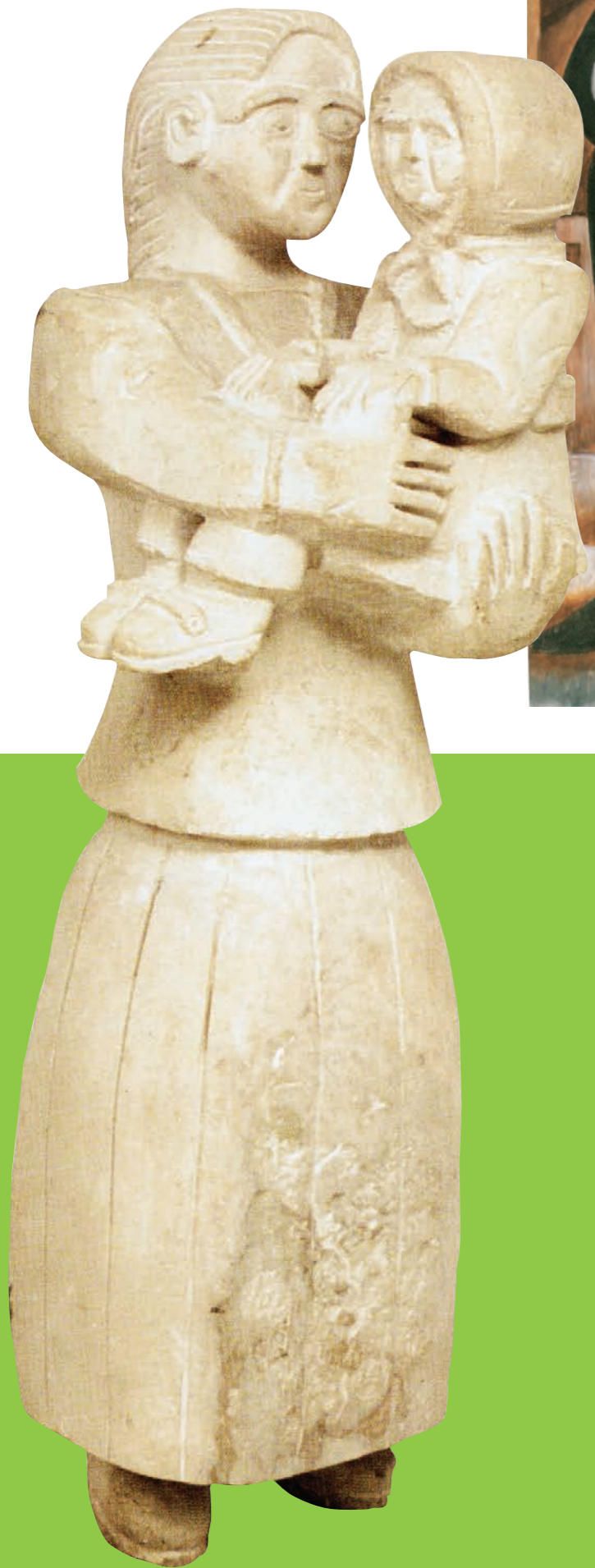
ΚΩΣΤΑΣ ΑΡΓΥΡΟΥ, Μητέρα και παιδί , πέτρα, 1992