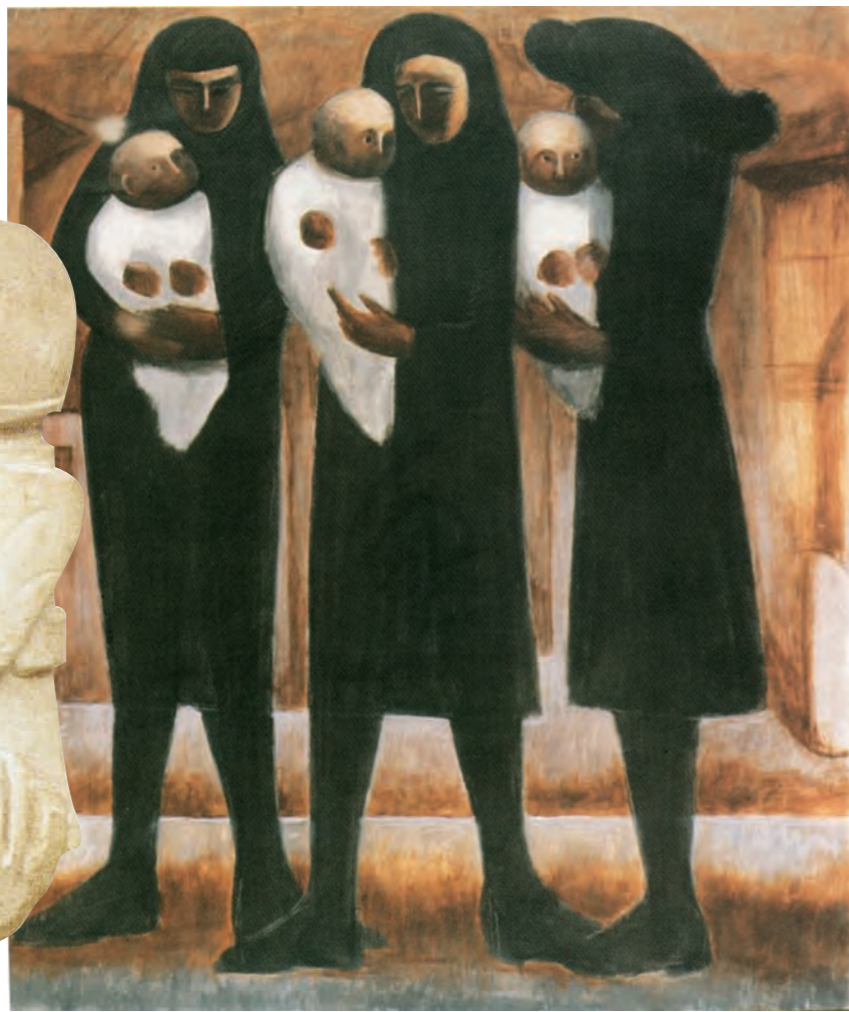
ΑΔΑΜΑΝΤΙΟΣ ΔΙΑΜΑΝΤΗΣ, Τρεις Μάνες , λάδι, 1972