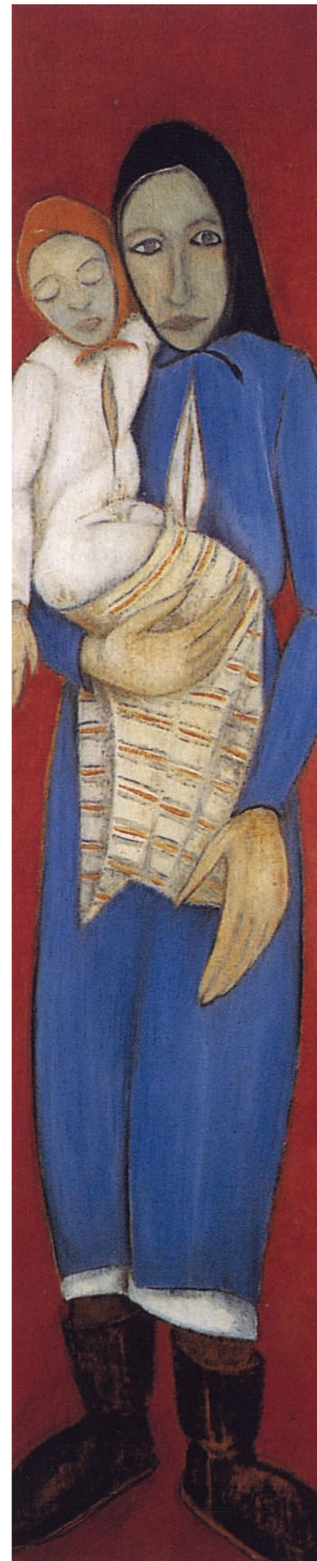
ΓΕΩΡΓΙΟΣ ΓΕΩΡΓΙΟΥ, Η Παναγία του Λιοπετρίου , λάδι, 1952