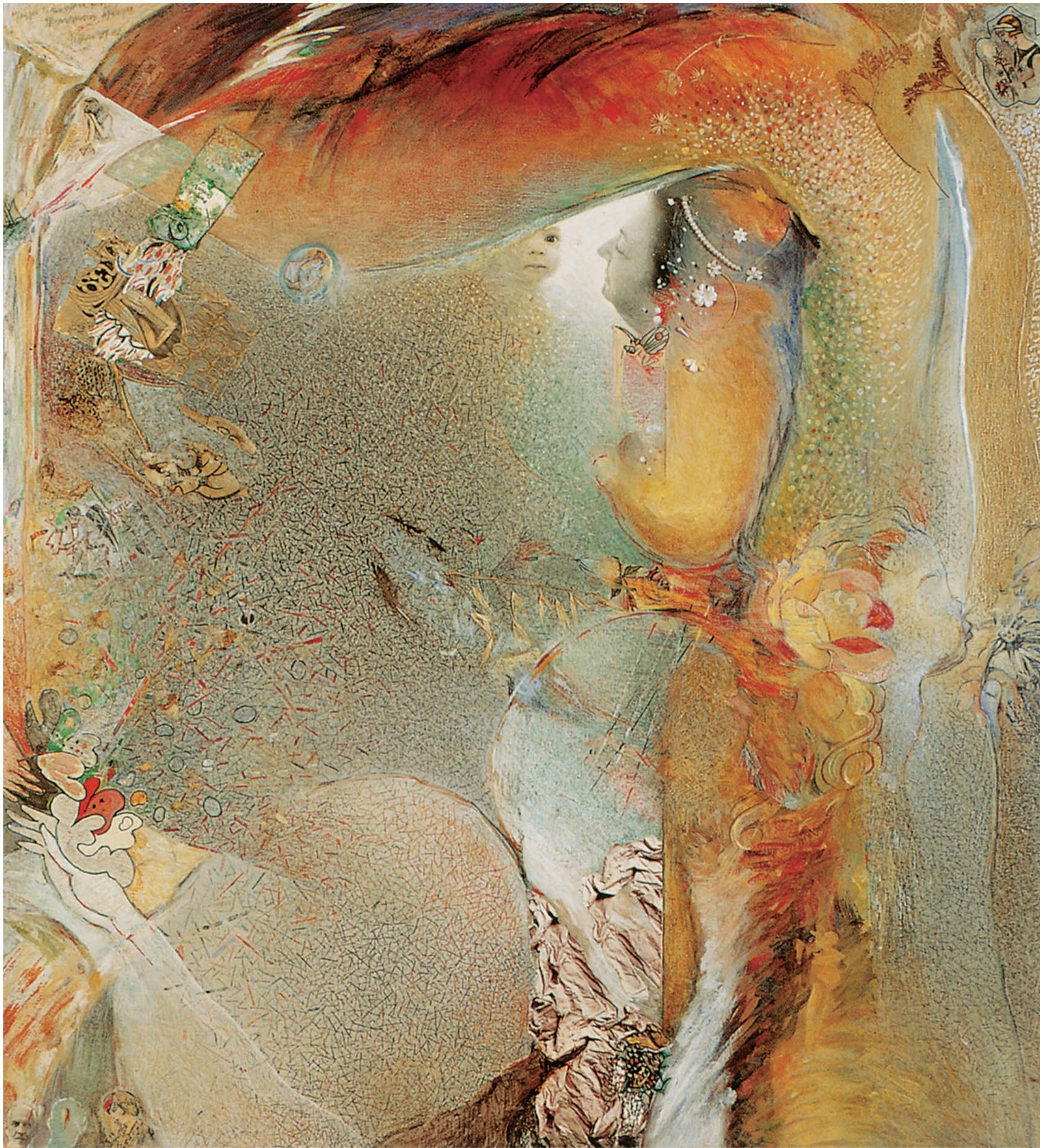
ΑΝΤΗΣ ΙΩΑΝΝΙΔΗΣ [1939 - ]

Γεννήθηκε στη Λευκωσία το 1939. Εργάστηκε ως γραφίστας στην Κύπρο και το εξωτερικό. Εικονογράφησε βιβλία, φιλοτέχνησε αφίσες, περιοδικά, νομίσματα και γραμματόσημα. Συνεργάστηκε με την τηλεόραση και το θέατρο, επίσης ασχολήθηκε με τη φωτογραφία, την τοιχογραφία, το κινούμενο σχέδιο και την ποίηση. Εργάστηκε σε ταινίες μικρού και μεγάλου μήκους ως οπερατέρ, μοντέρ, καλλιτεχνικός διευθυντής, σεναριογράφος και σκηνοθέτης. Από το 1982 ασχολείται αποκλειστικά με τη ζωγραφική.