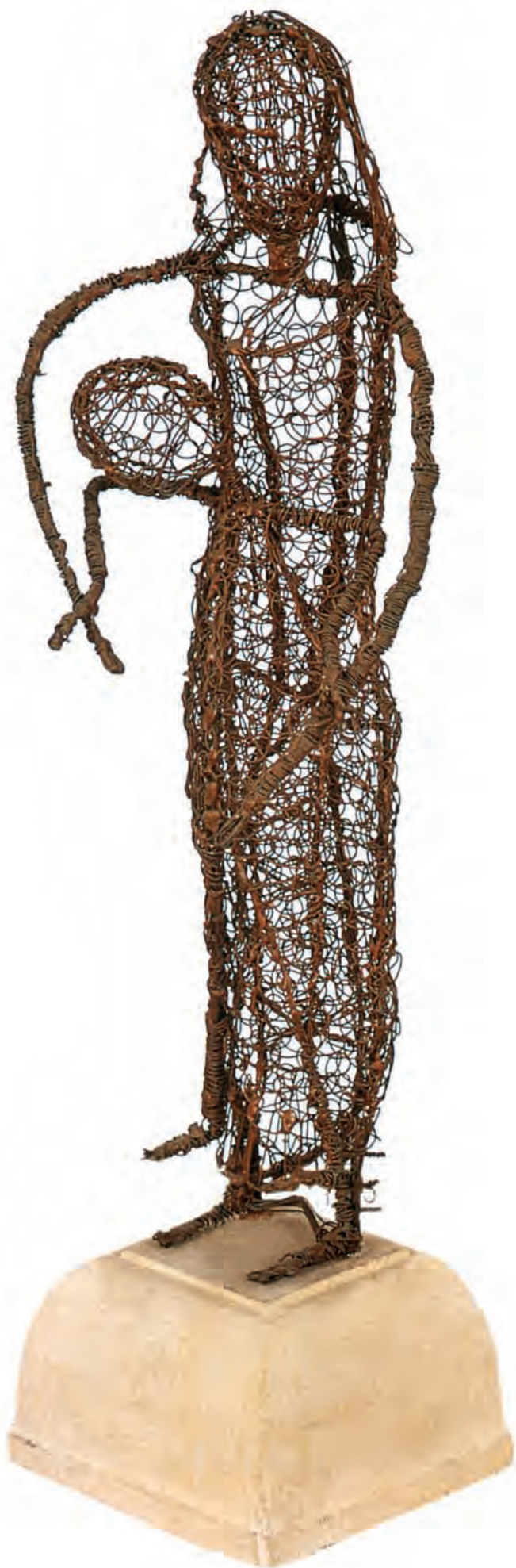
ΧΡΙΣΤΟΦΟΡΟΣ ΣΑΒΒΑ, Μητρότητα , σύρμα, 1965