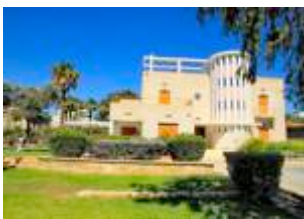
ΔΗΜΟΤΙΚΗ ΠΙΝΑΚΟΘΗΚΗ ΛΕΜΕΣΟΥ

Η έκθεση πραγματοποιήθηκε με την ευκαιρία της «Διεθνούς Εβδομάδας των Τεχνών στην Εκπαίδευση» (19-22 Μαΐου 2015) και είχε ως θέμα: