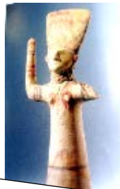
Πηγή 3: Η « θεά με τα υψωμένα χέρια » έγινε γνωστή στην Κύπρο από το Αιγαίο, όπου και λατρευόταν από την Εποχή του Χαλκού Πηγή:Καραγιώργη, J. (2007). Κύπρις, Η Αφροδίτη της Κύπρου. Αρχαίες πηγές και αρχαιολογικές μαρτυρίες. Λευκωσία: Ίδρυμα Α.Γ. Λεβέντη.