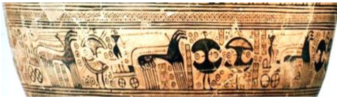
Αγγειογραφία από αγγείο (Ελλάδα)