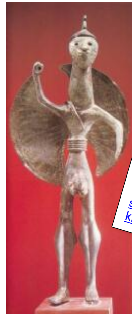
Χάλκινο ειδώλιο οπλίτη (Ελλάδα).