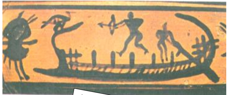
Αγγειογραφία από ελληνικό αγγείο (Ελλάδα)

Πηγή 1: Καραγιώργης, Β. (2002). Κύπρος. Το σταυροδρόμι της ανατολικής Μεσογείου 1600-500π.Χ. Αθήνα: ΚΑΠΟΝ, (σελ.134).