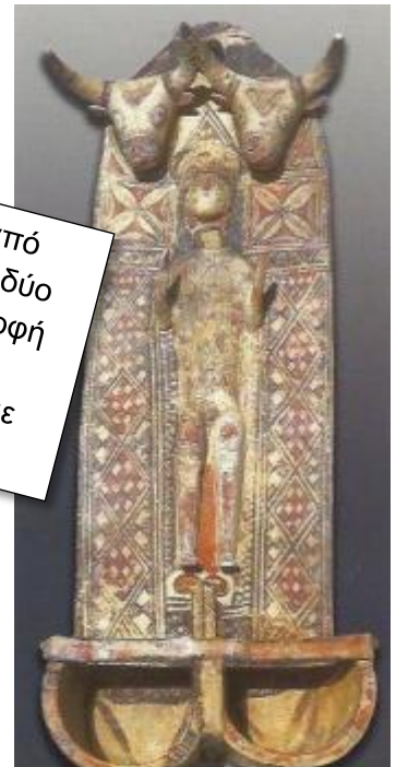
Πηγή 4: Πήλινος λυχνοστάτης από την Αμμόχωστο . Εκτός από τους δύο ταύρους, υπάρχει μια γυναικεία μορφή με χέρια λυγισμένα προς τα πάνω. Θυμίζει την κρητική «Μεγάλη Θεά» με τα υψωμένα χέρια.