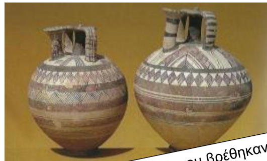
Πηγή 2: Ψευδόστομοι αμφορείς που βρέθηκαν σε τάφους στη Λάπηθο . Τα αγγεία μιμούνται την κεραμική τέχνη του Αιγαίου.