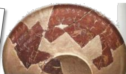
Πηγή 6: Φοινικικό κύπελλο . Βρέθηκε στο Κίτιον στο ναό της Αστάρτης. Πάνω υπάρχει επιγραφή στα φοινικικά, που αναφέρει ότι κάποιος ΜΕΛΑ από την Ταμασό, έβαλε μέσα στο κύπελλο τα μαλλιά του, προσφορά στη θεά Αστάρτη (φοινικικό έθιμο).