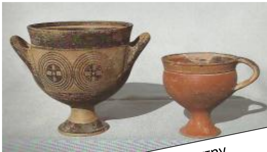
Πηγή 1: Αγγεία που βρέθηκαν στην Αμαθούντα . Είναι τα παλαιότερα εισαγόμενα ελληνικά (μυκηναϊκά) αγγεία.

Β. Συγκρούονταν ή συνεργάζονταν οι ομάδες των ανθρώπων της Γεωμετρικής Εποχής; Μελετώ τις πηγές και σημειώνω τεκμήρια (πληροφορίες) που με βοηθούν να απαντήσω το πιο ερώτημα. 1