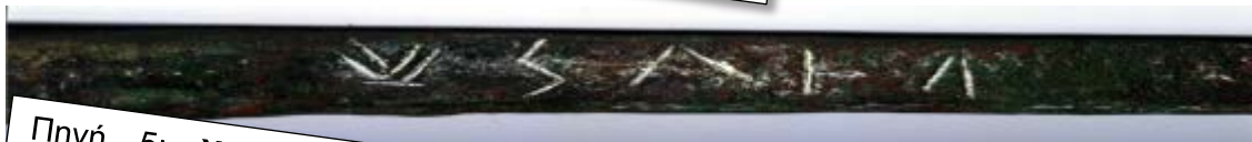
Πηγή 5: Χάλκινος οβελός από την Παλαίπαφο . Η επιγραφή γράφει «του Οφέλτη». Είναι η παλαιότερη ένδειξη χρήσης της ελληνικής γλώσσας στην Κύπρο.