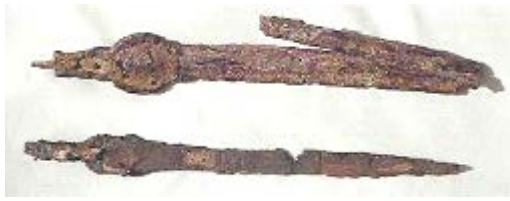
Δύο σιδερένια ξίφη (Παλαίπαφος)

Α. Συγκρούονταν ή συνεργάζονταν οι ομάδες των ανθρώπων της Γεωμετρικής Εποχής; Μελετώ τις πηγές και σημειώνω τεκμήρια (πληροφορίες) που με βοηθούν να απαντήσω το πιο ερώτημα.