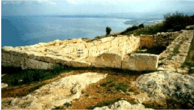
Αποθηκευτικός χώρος στο ανάκτορο του Βουνιού.

περιορισμένα. Το μόνο μνημείο που μπορεί να βοηθήσει στη μελέτη της οικιακής αρχιτεκτονικής αυτής της περιόδου είναι το ανάκτορο στο Βουνί, το οποίο οικοδομήθηκε κοντά στην αρχαία πόλη των Σόλων.