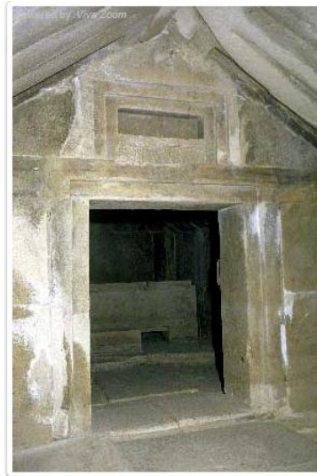
Τάφος από την Ταμασσό

Ερώτημα για συζήτηση: «Σήμερα πώς φτιάχνουμε τα σπίτια μας στην Κύπρο; Τι έχει αλλάξει και τι έχει μείνει το ίδιο;».